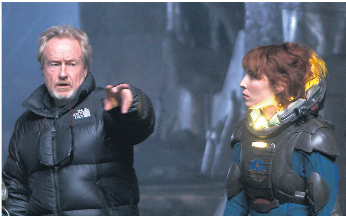
Ridley Scott et Noomi Rapace sur le plateau de Prometheus .