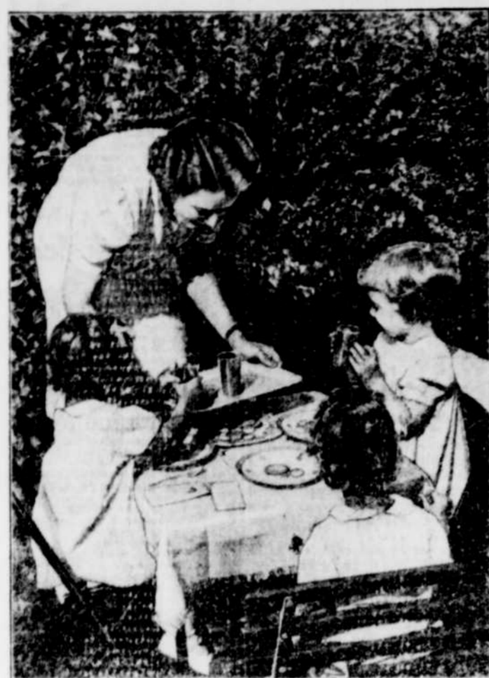
BREVAGE POUR LES PETITS: Le jus de tomates est une boisson rafraîchissante pendant les chaleurs; riche en vitamines, il peut être donné aux enfants qui en apprécient non seulement le goût, mais la couleur.

Nous nous sommes souvent demandé quel fut le premier bréviaire à manger des tomates. Ce fut probablement un petit garçon, qui comme tous les petits garçons avait envie de toucher et de manger tout ce qu'il trouvait.