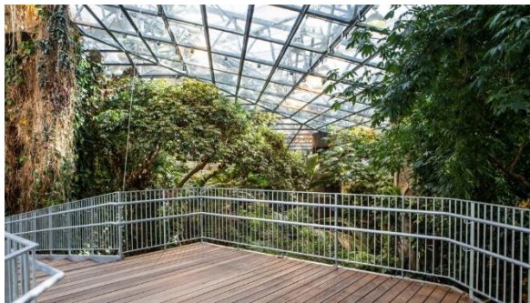
Vue de la passerelle

passerelle qui nous conduit, marche par marche dans la canopée de la Forêt tropicale et qui nous mène sur une nouvelle mezzanine. De là, on a aussi un point de vue en hauteur de l'Érablière des Laurentides et du Golfe du Saint-Laurent. De plus, on trouve sur cette mezzanine, la nouvelle zone d'exposition interactive de la Bio-machine, qui présente les coulisses du Biodôme.