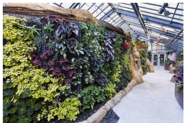
Espace pour la Vie – Jardin botanique

(Infolettre, septembre 2020 - Les amis du Jardin botanique)