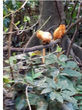
Tamarins dorés et

Pour le moment, les animaux ne sont pas tous de retour; ils seront introduits au fur et à mesure, le temps de les rapatrier et de leur donner le temps de s'adapter à leur nouveau milieu de vie. Lors de mon passage, j'y ai vu des castors, des manchots, des aras, un urubu à tête rouge,