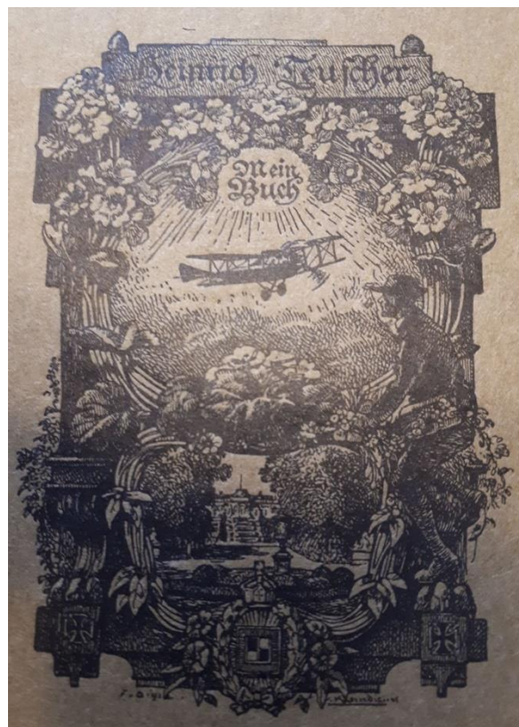
Ex-Libris Heinrich Teuscher

type « AEG C » furent construits entre 1914-1915 par la compagnie d'électricité AEG.