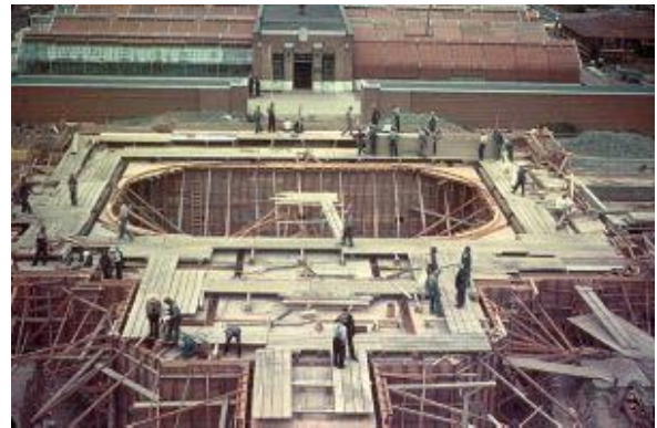
Construction des serres