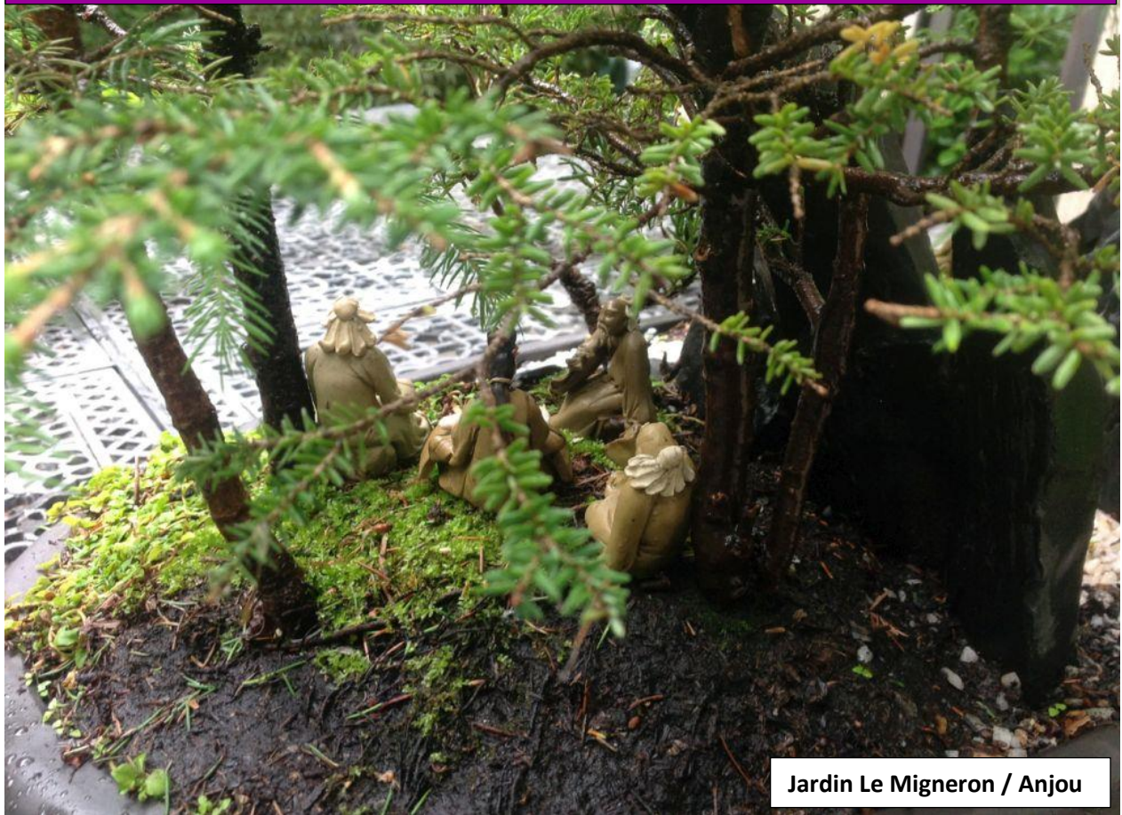
Jardin Le Migneron / Anjou