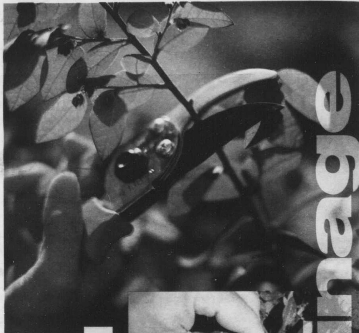
TAILLE - Pendant tout l'été, procédez régulièrement à la taille des fleurs fanées pour permettre au plant de garder toute sa force pour les fleurs en santé.

Chaque plante a des besoins précis en matière de taille. Du type de coupe jusqu'au moment de la coupe, consultez un conseiller dans un centre du jardin près de chez vous si vous avez le moindre doute. Une plante bien taillée sera une plante en bonne santé!