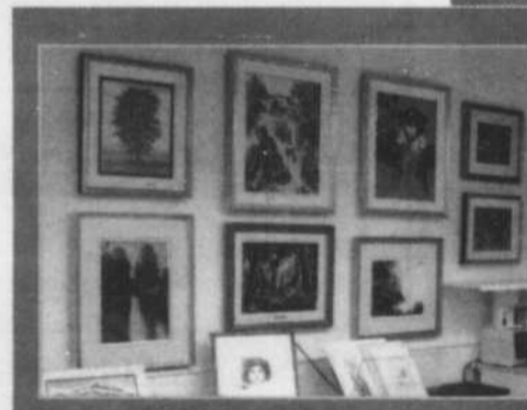
DÉCOR - Dès notre entrée, une véritable galerie d'art se dresse devant nous.