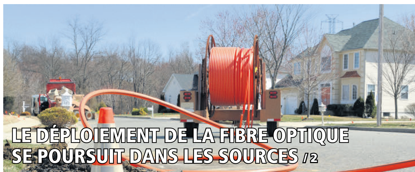
LE DÉPLOIEMENT DE LA FIBRE OPTIQUE SE POURSUIT DANS LES SOURCES / 2