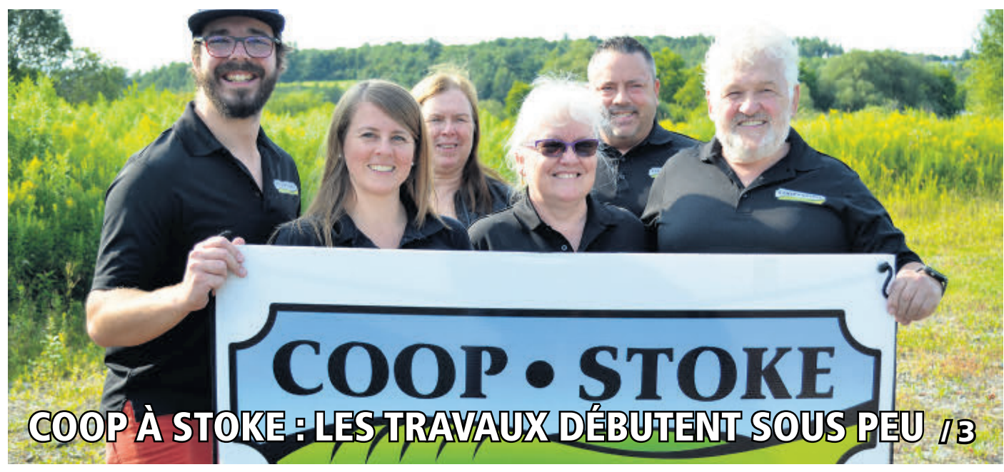
COOP À STOKE : LES TRAVAUX DÉBUTENT SOUS PEU / 3