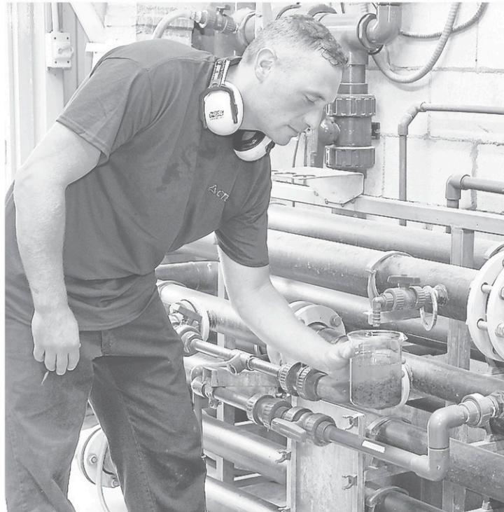
Des échantillons sont prélevés régulièrement pour contrôler la qualité des matières.

Selon lui, des « changements significatifs » ont ainsi été apportés au cours des dernières années sur la façon d'opérer le site. Et il semble que ça ne soit pas terminé. Le CTBM veut être en mesure de faire face aux défis de demain pour la valorisation des déchets.