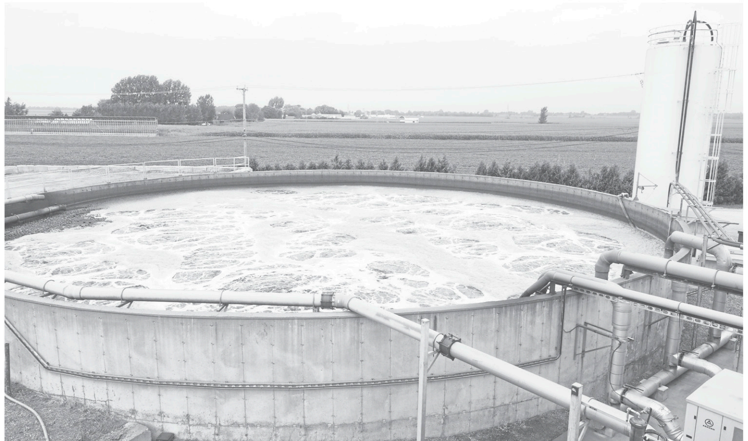
L'endroit dispose d'installations pour y effectuer du traitement d'eau.