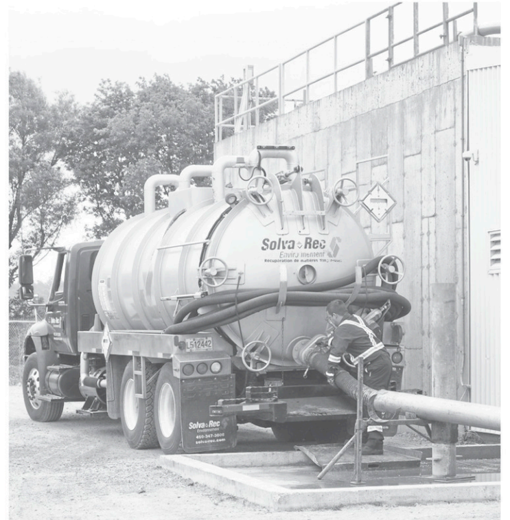
Les allées et venues des camions font l'objet d'un suivi serré au CTBM.