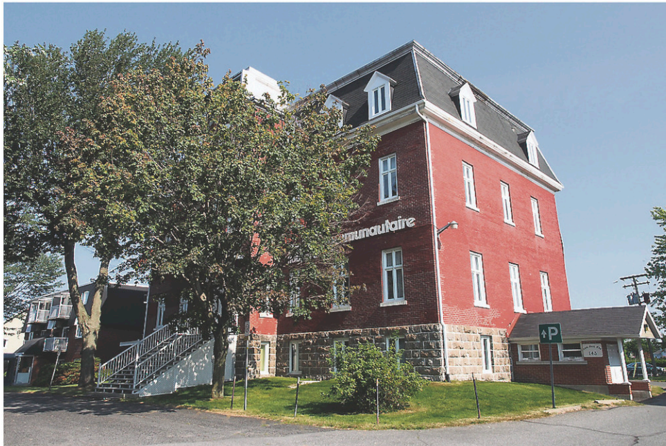
Selon le maire de Saint-Pie, le centre communautaire devrait tomber sous le pic des démolisseurs en juillet 2016.