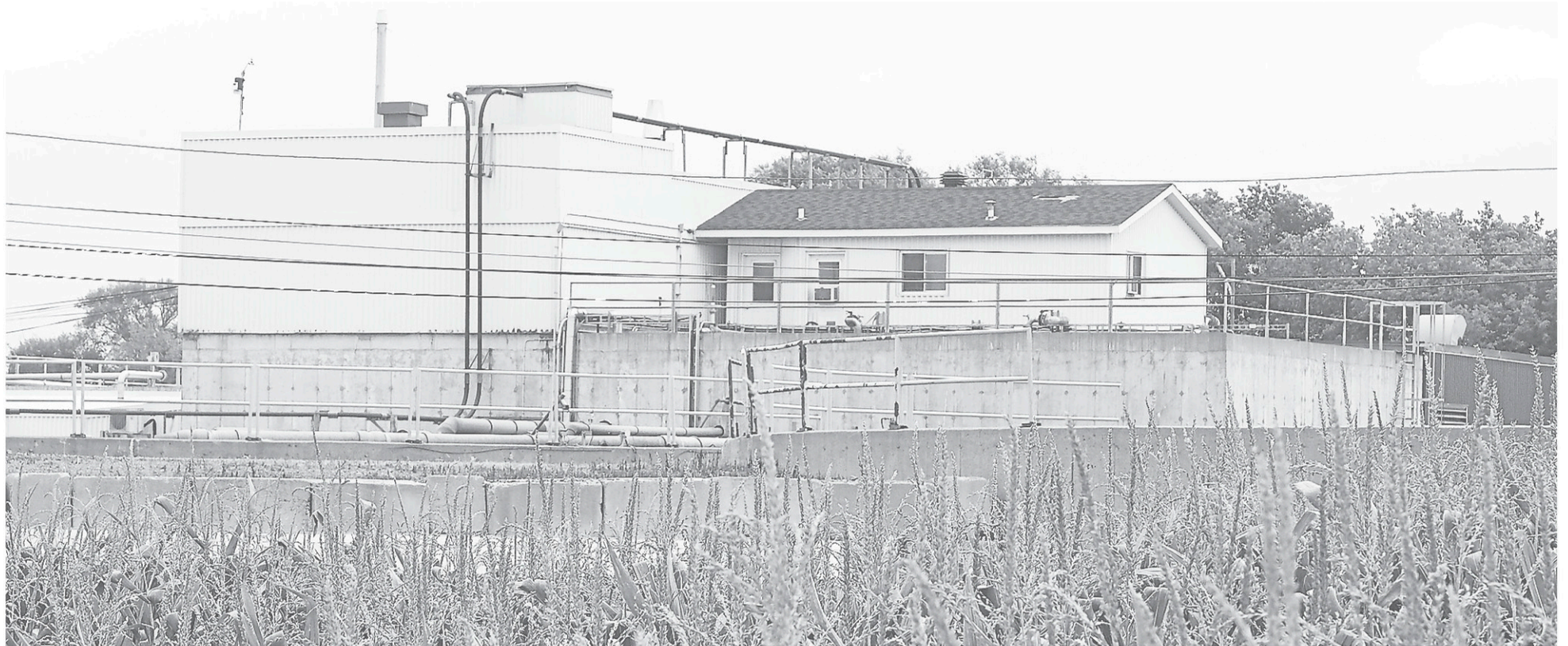
La production agroalimentaire, notamment, génère des déchets, des résidus, traités dans les installations du Centre de traitement de la biomasse de la Montérégie.