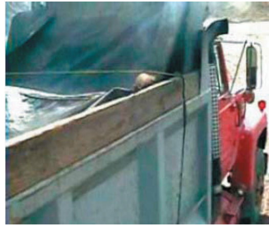
Figure 2 : Système de maintien de la bâche au moyen d'une courroie