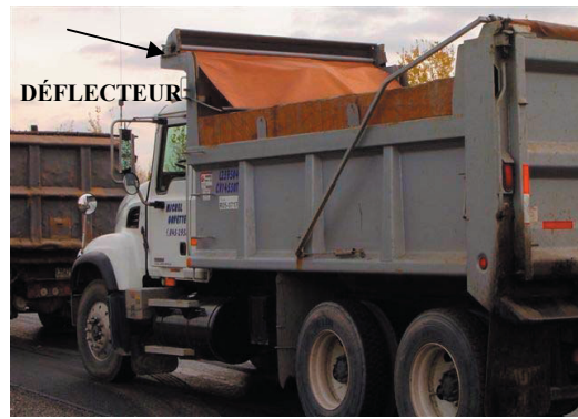
Figure 4 : Système de maintien de la bâche par un système mécanique