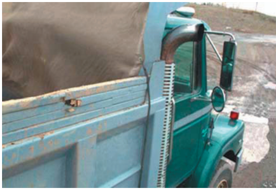
Figure 3 : Système de maintien de la bâche au moyen d'élastiques