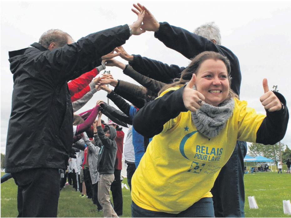
Les survivants du cancer étaient invités à passer sous un pont formé par les participants.