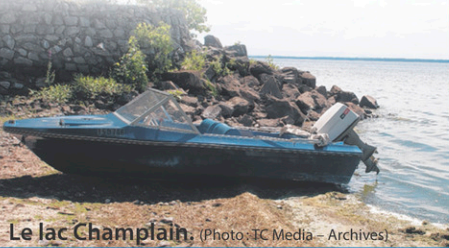
Le lac Champlain.

«Aujourd'hui, nous sommes en 2017 et la situation se dégrade à vue d'œil. Il est primordial que le gouvernement du Canada reconnaisse l'importance de cet enjeu et agisse en conséquence», dit-il.