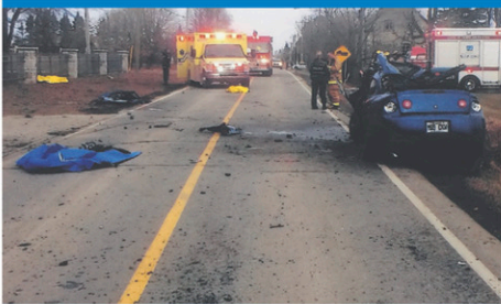
L'accident mortel est survenu sur le rang Saint-Paul à Saint-Rémi.