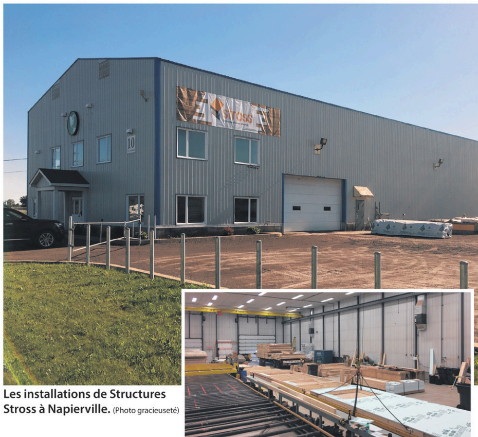
Les installations de Structures Stross à Napierville.

« On partage la même philosophie. On a bâti une marque, mais on ne peut rien faire sans les