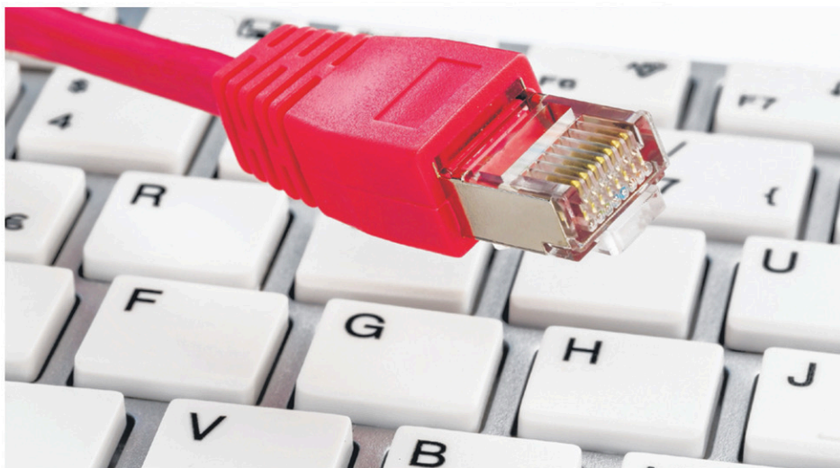
C'est une couverture à 100% en fibre optique que bénéficieront les résidents de Saint-Georges-de-Clarenceville.

En avril 2016, la MRC du Haut-Richelieu annonçait un investissement de 4,8 M$ pour