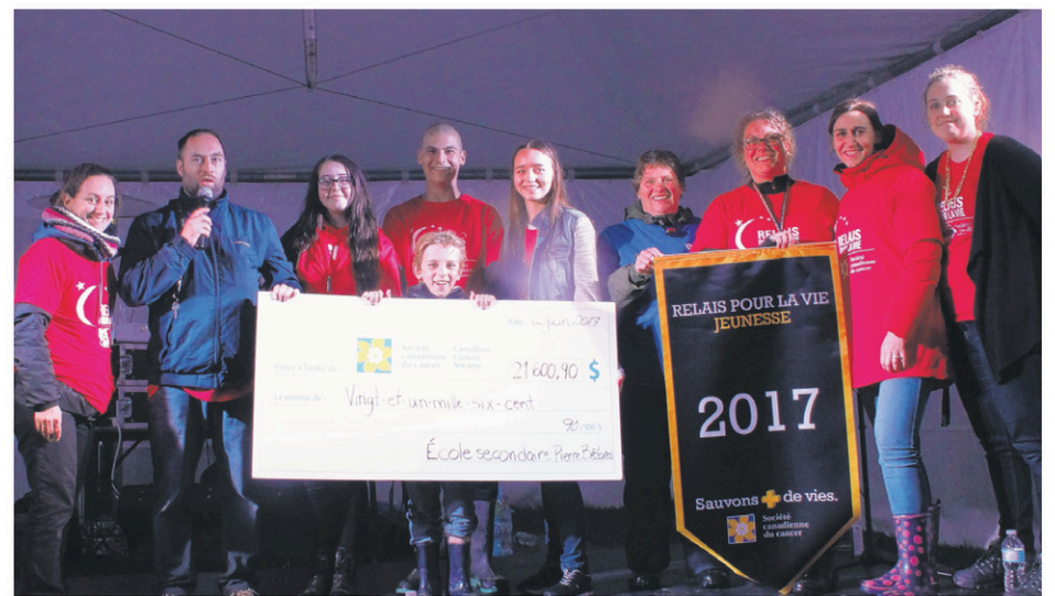
Cette première édition a permis de récolter 21 600$.