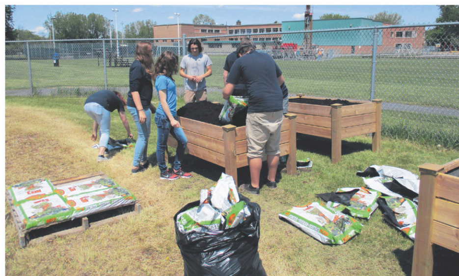
Des élèves ont donné un coup de main pour mettre la terre dans les bacs et planter les légumes.