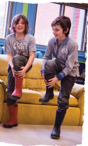
ATELIER MUSIQUE AU CORPS

Expérimenter une façon moderne de composer la musique, voici ce qui est proposé aux enfants. Ils imaginent d'abord les bruits et sons d'images de bandes dessinées telles Boule et Bill ou Tintin . Puis, ils créent la trame sonore de leur propre B.D. et en dessinent la partition.