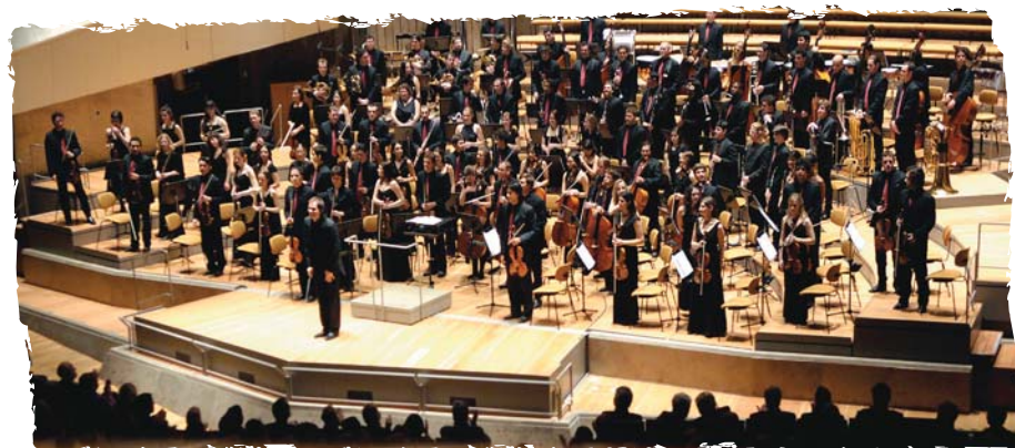
L'ORCHESTRE MONDIAL DES JEUNESSES MUSICALES À LA PHILHARMONIE DE BERLIN

Les Jeunesses Musicales du Canada font partie d'un vaste réseau international qui compte 73 associations membres issues de 59 pays, rayonnant dans plus de 2 000 villes des quatre coins du globe, tous rassemblés sous la bannière Jeunesses Musicales International (JMI / www.jmi.net ). L'UNESCO considère les JMI comme l'organisation culturelle pour la jeunesse et la musique la plus importante au monde et reconnaît son action en faveur de la paix mondiale. En ce sens, les JMC abondent et soutiennent la Convention de l'UNESCO relative aux droits de l'enfant.