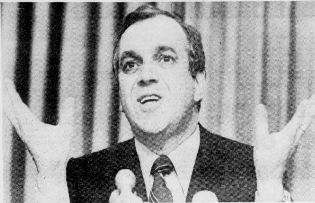
Ed Broadbent, chef du Nouveau Parti démocratique