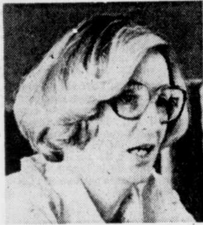
Mme Lise BACON

Au cours de différents entretiens menés par LE SOLEIL, il ressort clairement que la majorité d'entre eux demeureront fidèles au chef actuel du Parti libéral, M. Claude Ryan. Seul