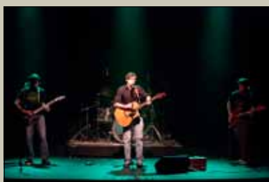
Les GoÉlans, prix du public