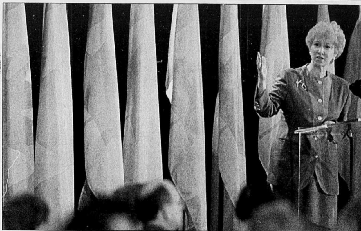
Kim Campbell a expliqué sa décision de n'acheter que 43 hélicoptères par sa volonté de réduire le déficit.

Ottawa — Après avoir défendu avec acharnement le programme d'achat d'hélicoptères militaires, la première ministre Kim Campbell a reculé d'un pas hier en annonçant que le Canada se portera acquiescent de 43 hélicoptères de combat plutôt que 50.