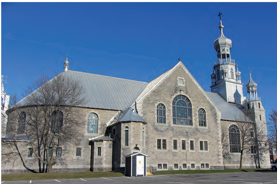
D'autres travaux correctifs doivent être exécutés en priorité sur l'église de Sainte-Anne-des-Plaines.