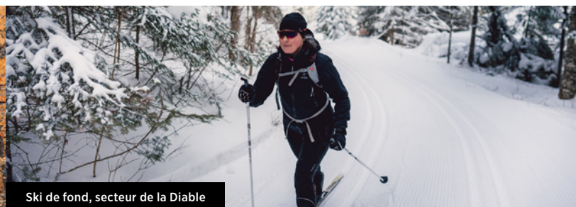
Ski de fond, secteur de la Diable

L'immense réseau de sentiers du parc vous place aux premières loges d'un spectacle flamboyant : l'automne en pleine splendeur. Quatre sentiers vous mèneront à des belvédères offrant des panoramas à couper le souffle : la Roche et la Corniche (secteur de la Diable), l'Envol (secteur Pimbina-Saint-Donat) et les Grandes-Vallées (secteur de L'Assomption). D'autres sentiers mènent à des refuges accessibles de jour, parfait pour une pause en pleine nature. Consultez le tableau des sentiers à la page 3 pour plus de détails.