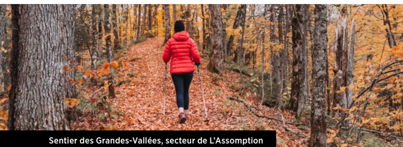
Sentier des Grandes-Vallées, secteur de L'Assomption

Guidé par un professionnel, vivez une aventure inoubliable où adrénaline et liberté se mêlent aux paysages grandioses du parc. Sensations fortes garanties ! Consultez les détails à la page 6.