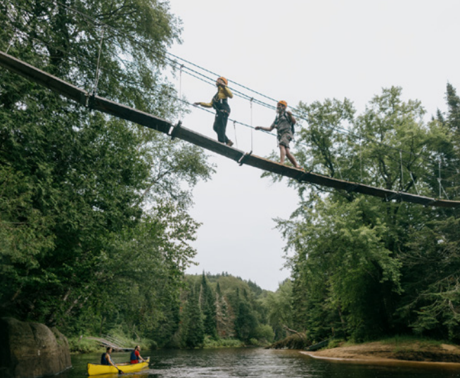
Via ferrata du Diable, secteur de la Diable