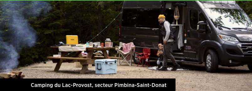
Camping du Lac-Provost, secteur Pimbina-Saint-Donat