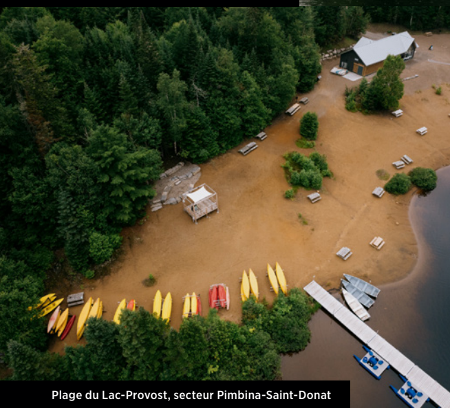
Plage du Lac-Provost, secteur Pimbina-Saint-Donat