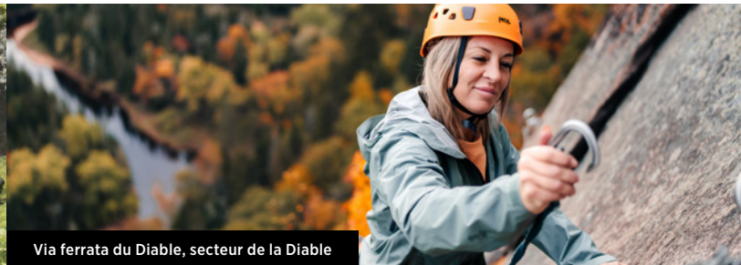
Via ferrata du Diable, secteur de la Diable

La Chute-aux-Mûres (secteur de la Cachée), agrémentée d'une petite passerelle en bois.