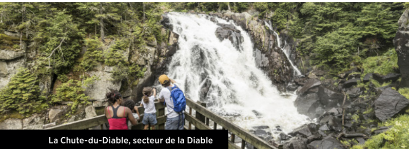
La Chute-du-Diable, secteur de la Diable

Réservation requise. Renseignez-vous aux différents postes d'accueil, au Centre de services du Lac-Monroe ou au Centre de découverte.