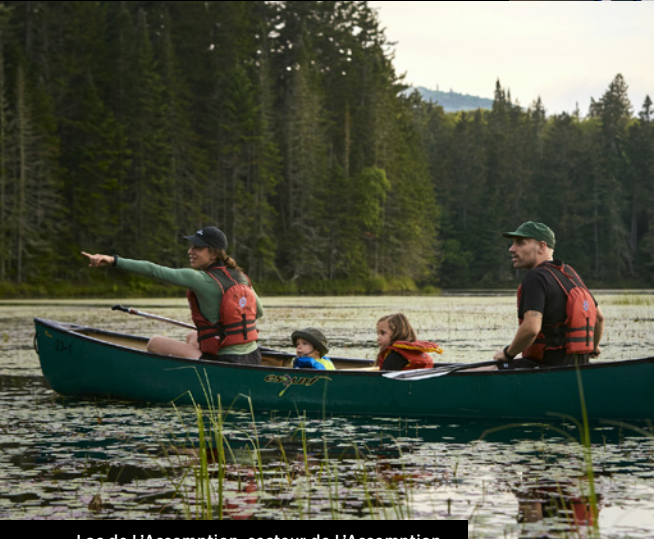
Lac de L'Assomption, secteur de L'Assomption