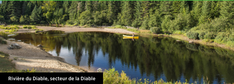
Rivière du Diable, secteur de la Diable

La plage du Lac-Provost a également fait peau neuve l'an dernier ! Cet été, venez profiter d'un cadre encore plus agréable avec un tout nouveau bâtiment abritant le centre de location et un bloc sanitaire, ainsi qu'un stationnement agrandi pour un meilleur accès. Enr: 199791