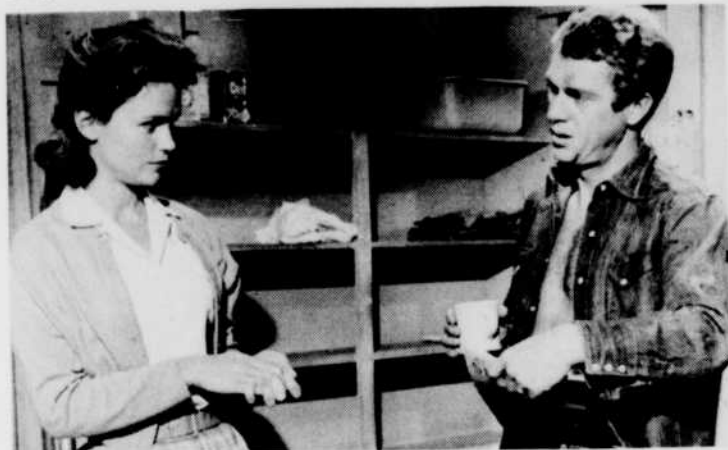
«Le Sillage de la violence»

juin), Homicide (20 juin), le Massacre des Sioux (27 juin), l'Homme à la Buick (4 juillet), la Blonde de Pékin (11 juillet), Froid dans le dos (25 juillet), Cinq mille dollars sur l'as (1er août), Quatre hommes à abattre (15 août) et la Vallée de la vengeance (29 août).