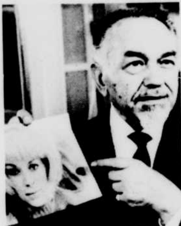
«La Blonde de Pékin».