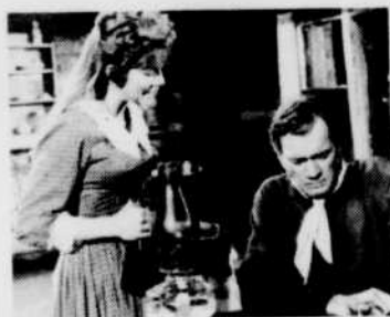
«Le Massacre des Sioux».