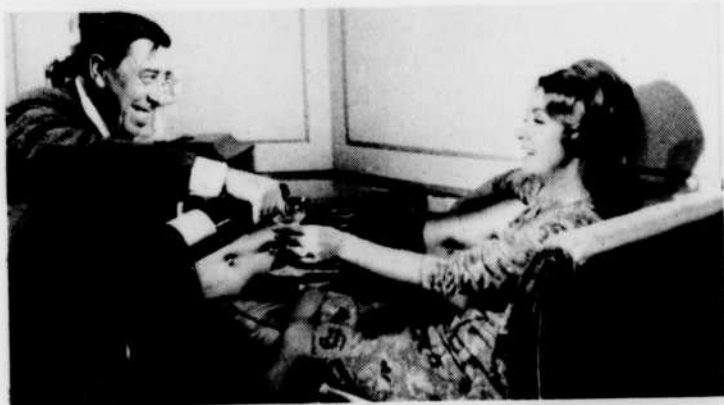
«L'Homme à la Buick».