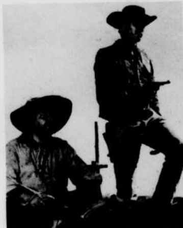
«Cinq mille dollars sur l'as».