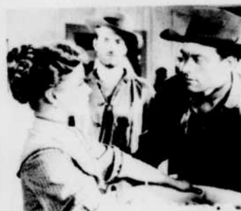
«La Vallée de la vengeance».