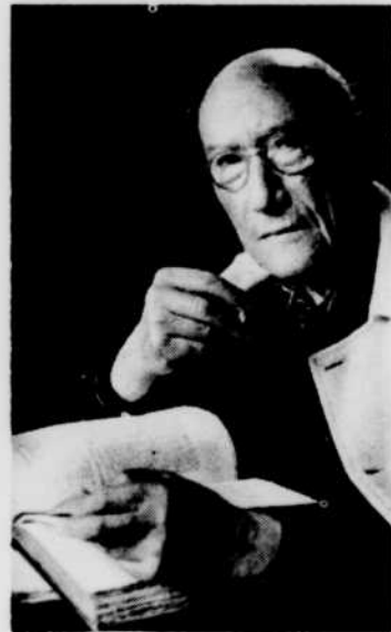
A l'émission «Cinéma», le mardi 19 mai à 13 h 00, une biographie d'André GIDE, réalisée par Marc Allégret. De vieilles bandes muettes nous font assister à des entretiens entre Gide, Martin du Gard, St-Exupéry et Valéry; puis ce sont des conversations intimes entre Gide et Jean Schlumberger ou Maurice Garçon; enfin, Gide au milieu de sa famille avec ses petits-enfants (Français 1952).