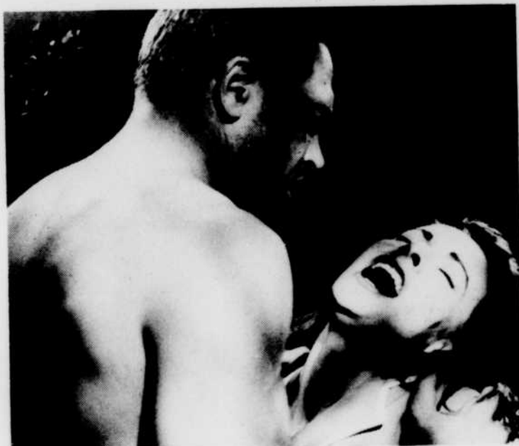
«Froid dans le dos».