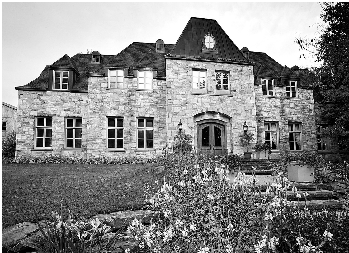
Le château Taillefer Lafon, bâti en 2005 dans l'ouest de l'île.

Entre les deux tablées, une dégustation de vins est prévue dans le jeune château Taillefer Lafon, bâti en 2005 dans l'ouest de l'île. La même année, l'entreprise familiale a été