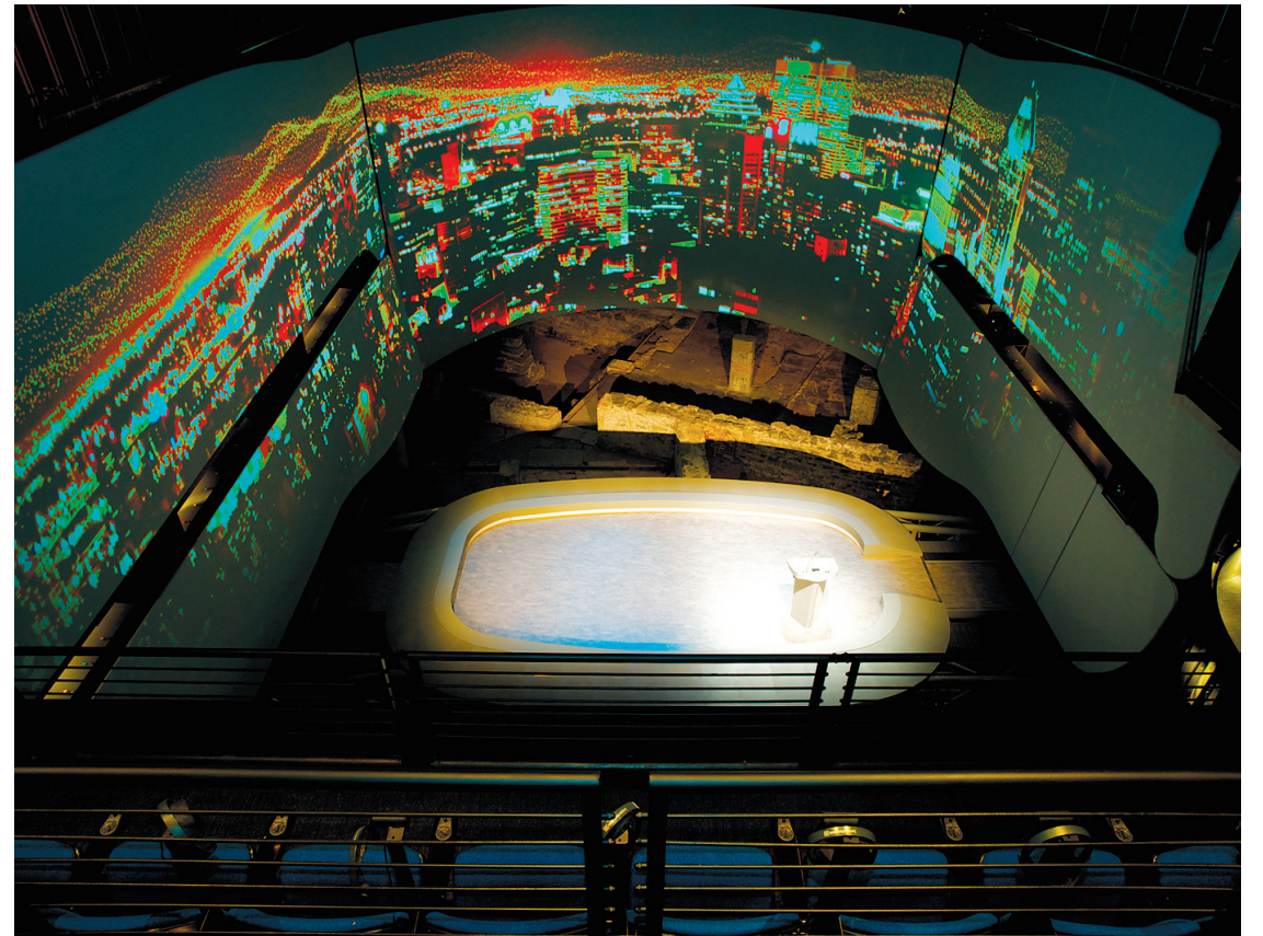
MICHEL JULIEN \ MUSÉE POINTE-A-CALLIÈRE

■ Ancienne Douane: édifice néoclassique (1836-1838) qui est l'un des premiers éléments architecturaux à témoigner de la présence britannique à Montréal. Pour un cocktail ou une réception. Ca-