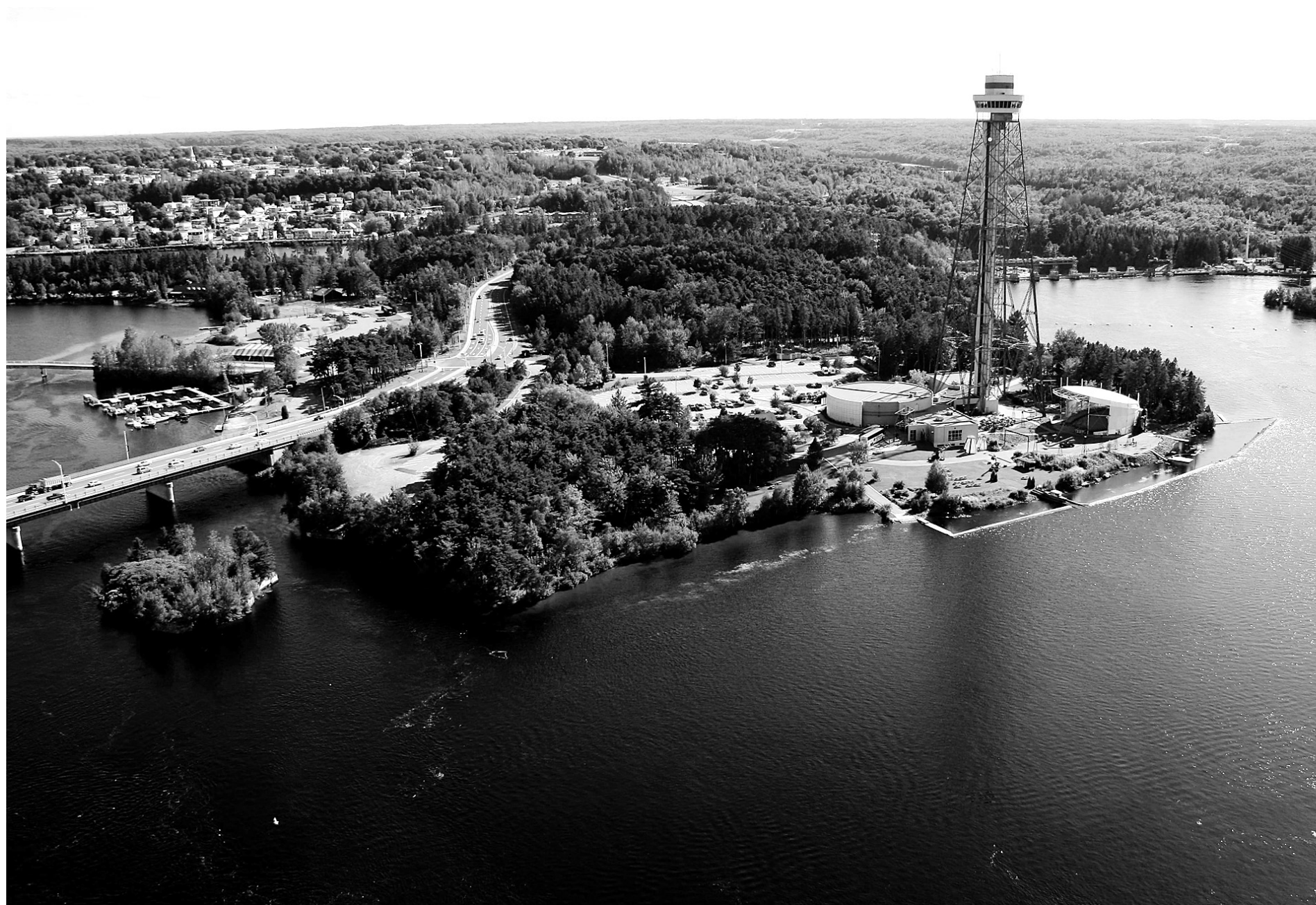
Shawinigan et sa Cité de l'énergie, sur les bords de la rivière Saint-Maurice

Son occupation revêt-elle un caractère très familial? L'agente précise: «Effectivement, en raison des places de camping et des plages qui sont là. Pourtant, bien qu'il soit très fréquenté, en raison de son immense superficie on se croit seul au monde à l'intérieur de celui-ci, en toutes saisons.» Le Parc de la Mauricie, qui a fêté ses 40 ans d'existence en 2010, est situé à tout au plus