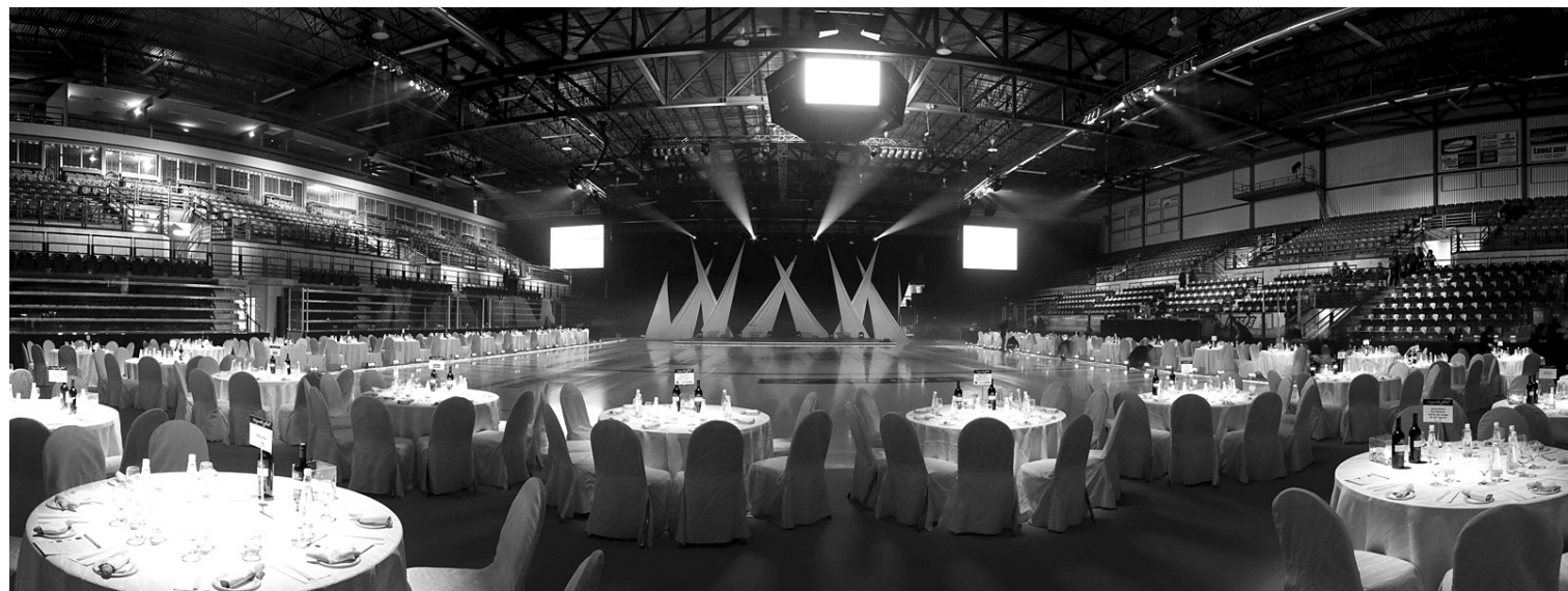
Le Centre Bionest est un amphithéâtre moderne doté de 4000 sièges.

«Au début, on ne sortait pas à l'extérieur pour vendre notre région, mais maintenant on se