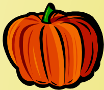
Belle période automnale

Les personnes intéressées ont jusqu'à la fin de mars pour envoyer leur texte. A vos plumes, donc!