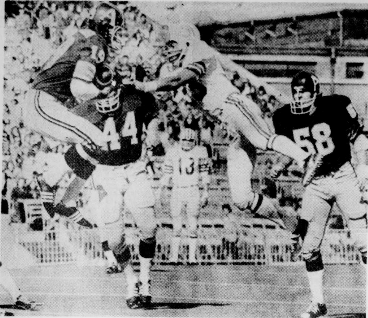
En plein vol. Cette scène a été croquée au cours de la joute Alouettes-Toronto partie décrochée par cette der-