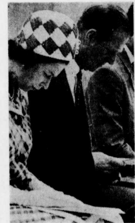
La famille royale a assisté en fin de semaine à une messe célébrée à Dauphin, au Manitoba. Cette province célèbre cette année son centenaire. (Voir nouvelle page 13).