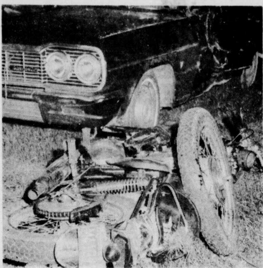
La moto de la victime a été projetée à plusieurs pieds de distance à la suite de la collision.