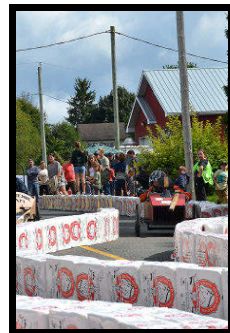
13 bolides étaient inscrits à la course

Il rappelle également que le succès de l'événement repose aussi sur un effort collectif des membres du comité organisateur ainsi que de la population.