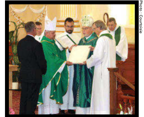
La cérémonie de désacralisation de l'église de Saint-Apollinaire.

Le nouveau pôle contiendra une salle de spectacle ouverte à l'année avec 300 places assises. L'entrée sera réaménagée avec un vestiaire, un bar et toutes autres commodités. Il sera également possible de louer la