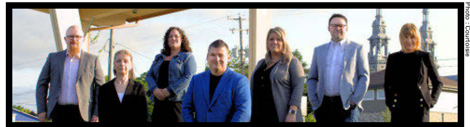
L'équipe de Pour Sainte-Croix.