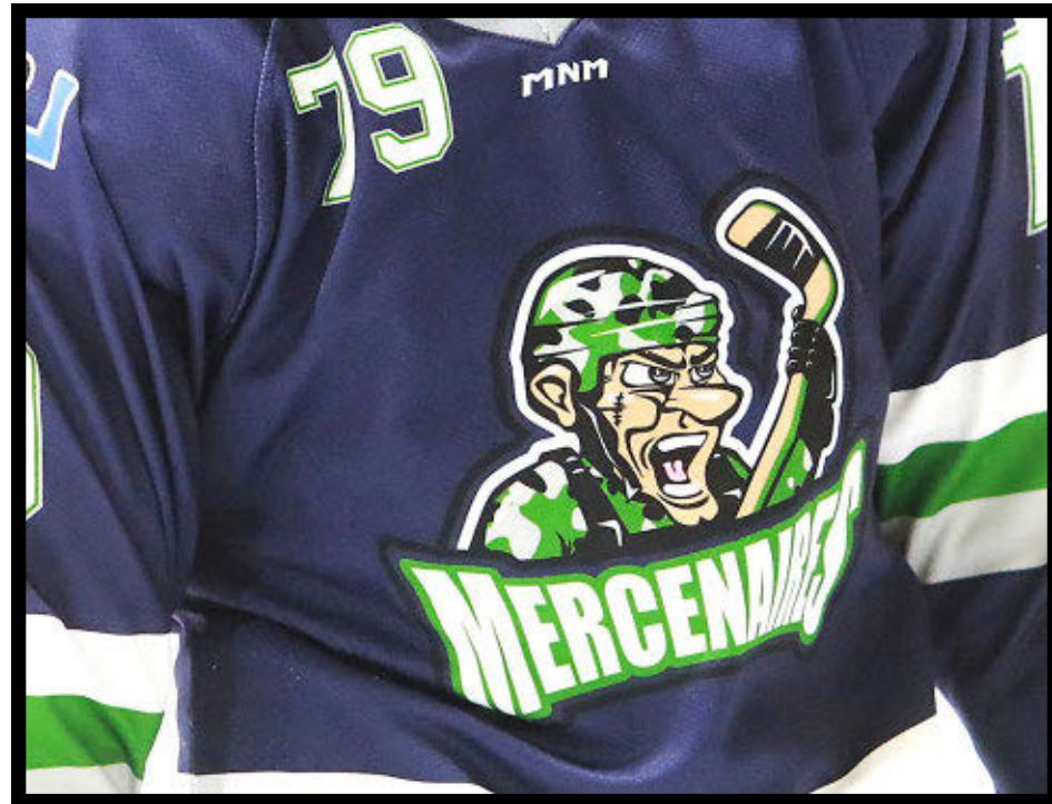
La saison des Mercenaires de Lotbinière commencera officiellement le 3 octobre.

d'entraînement comptant deux pratiques le 9 septembre, à l'aréna de Saint-Croix à 21h30, et le 15 septembre, à l'aréna de Saint-Gilles à 21h. Elle jouera une partie hors-concours le 19 septembre, à 20h30,