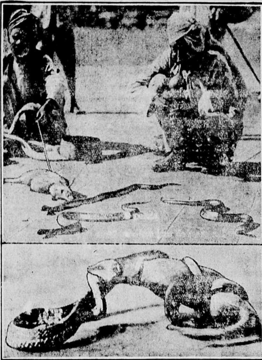
Sur la photo supérieure, nous voyons un Hindou en train d'exciter, avec sa flûte, quelques cobras sur lesquels son copain va lancer une mangouste. Sur celle du bas, la mangouste dévore la tête d'un cobra, qui l'enferme de ses puissants anneaux.

Ces photos, qui nous sont communiquées par l'un des passagers actuelle- ment en croisière autour du monde, à bord de l'"Empress of Scotland" du Pacifique Canadien, représentent deux épisodes d'un combat à mort entre une mangouste et un cobra, combat auquel il fut donné d'assister à un groupe de passagers de l'"Empress of Scotland", lors de leur récent passage à Bombay.