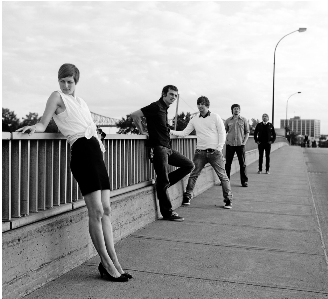
Rome Romeo dans une pose rappelant la pochette de l'album Autoamerican de Blondie.

« Ça a été difficile de se sortir des patterns punk-rock, ajoute