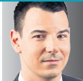
HUGO DUMAS CRÉPAGE DE PERRUQUE À PLUSIEURS MILLIONS PAGE 3

Découvrez les premières, les lancements et les extraits de spectacles sur lapresse.ca/videos/arts