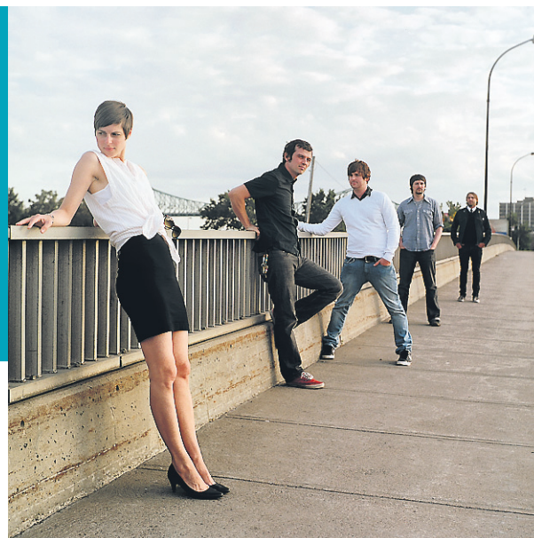
VIVRE LE DÉSIR D'ENFANT SOUS LA LOUPE PAGE 6