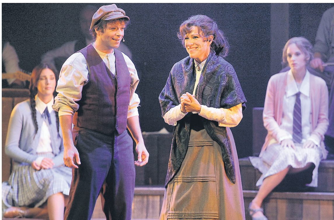
Les acteurs principaux des Filles de Caleb