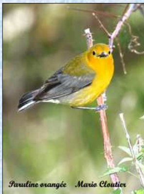
Paruline orangée Mario Cloutier

Toute cette structure savamment déployée est soutenue par des photos de superbe qualité. Soigneusement choisies et montées, elles sont diversifiées et nous ont ravis. Plusieurs photos d'un même oiseau ou groupe d'oiseaux, telle la famille Bernache, sont de nature à captiver notre attention et à faire image dans notre imaginaire ! Nous avons droit à de magnifiques clins d'œil : l'arbre avec une figure, le canard sous l'eau, les arbres en voûte évoquant un tunnel.