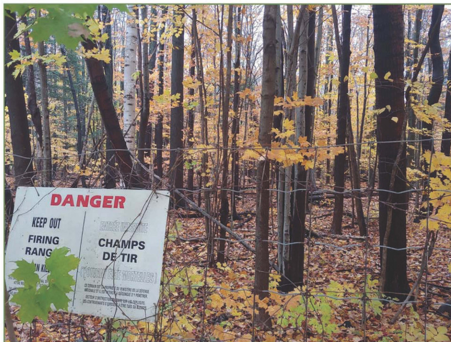
De nouveaux comités ont été créés pour répondre à certains besoins de la population de Sainte-Julie, soit pour le logement abordable; le transfert du boisé de la Défense nationale à la SÉPAQ (photo); le commerce local; ainsi que le Comité citoyen des aînés.