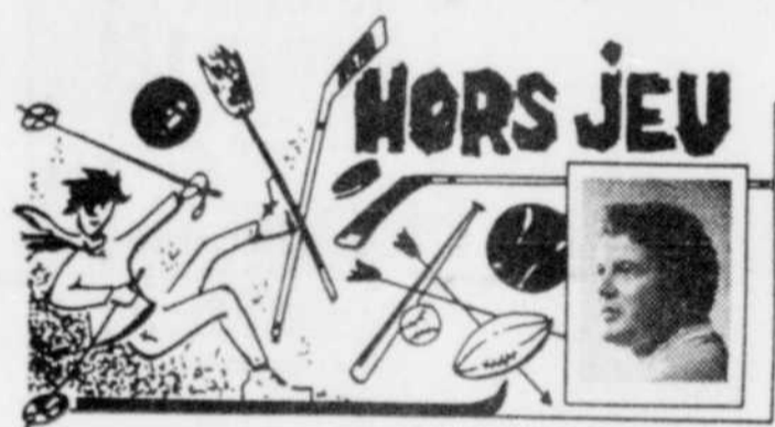
par Michel ROCHON