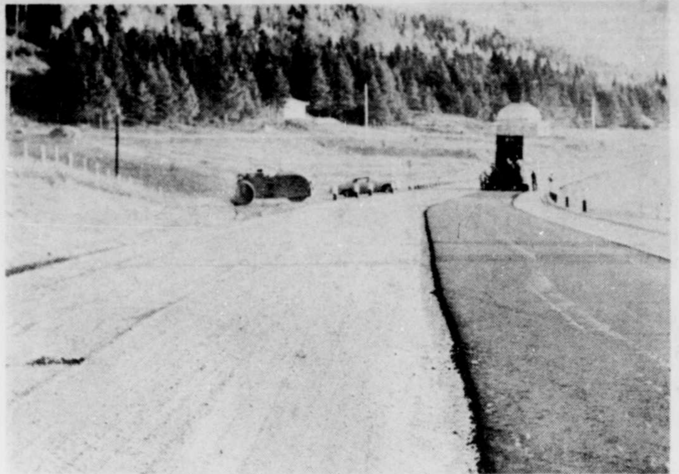
LES TRAVAUX DE CONSTRUCTION DE LA NOUVELLE ROUTE de Saint-Zénon à Saint-Michel-des-Saints sont presque terminés. Dans le moment, la route est encore partiellement inachevée mais des travaux de pavage s'effectuent et le tout sera terminé bientôt.

Les conseillers de Berthierville et le maire, le notaire J.-Dominique Giroux, ont cru bon de construire ces deux voies d'accès, premièrement pour se rendre au centre culturel et aussi pour permettre une plus grande facilité au transport des étudiants dans les autobus scolaires.