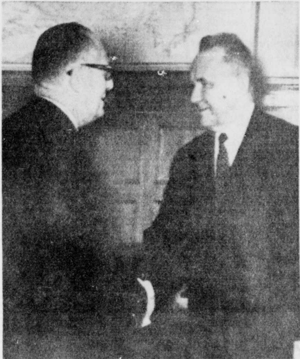
LE MINISTRE FRANCAIS DES Affaires étrangères, M. Maurice Schumann, est reçu par le premier ministre de l'URSS, M. Alexis Kossyguine, à droite, lors de la première visite de M. Schumann à Mos

Conférences Jeudi, M. Nixon a longuement conféré avec son ambassadeur à Saigon, M. Ellsworth Bunker. Aujourd'hui il s'entretient avec son ministre de la Défense, M. Melvin Laird, ses chefs d'état-major, notamment le général Earle Wheeler, chef de l'état-major interarmes, qui revient d'une visite d'études au Vietnam, et le Dr Henry Kissinger, le principal artisan de sa politique étrangère. Lundi ou mardi il s'enfermera dans son bureau avec les deux principaux négociateurs américains à l'avenue Kléber, M. Henry Cabot Lodge et M. Philip Habib, rappelés en consultation. Le porte-parole présidentiel, M. Ronald Ziegler, a précisé que M. Lodge recevra certaines instructions donnant à penser que les Etats-Unis s'appêtent à prendre de nouvelles initiatives à Paris.