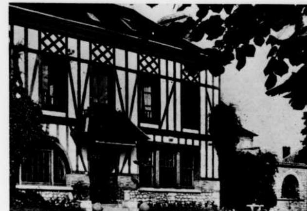
L'Hôtel Beauséjour, à Léry, en Normandie, où a été réalisée une partie de l'émission "Prenez la route" du 6 juillet.