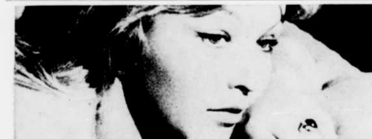
La belle Marina Vlady est la partenaire de Raymond Pellegrin dans "Le Crâneur", à "Cinéma", vendredi soir à 11 heures.