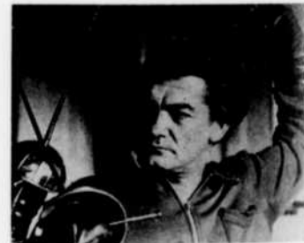
Jean Marais dans "Le Capitaine Fracasse", jeudi soir à 8 heures.