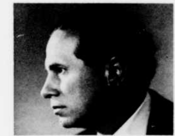
Antal Dorati dirigera "Les Fontaines de Rome", vendredi soir à 11 heures.