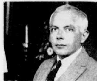
Bela Bartok, dont on présentera les Quatuors nos 1 et 2, samedi à 6 h. 17.