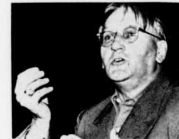
Hermann Scherchen, à "Scène lyrique", lundi soir à 8 heures.