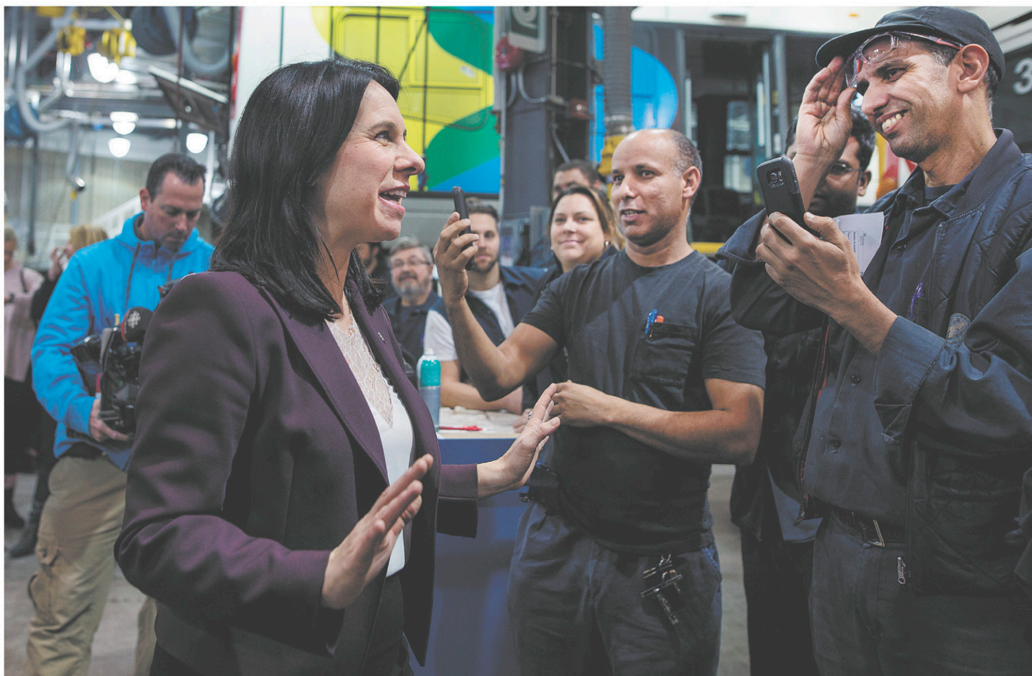
Valérie Plante s'est entretenue avec des employés enthousiastes de la Société de transport de Montréal au Centre de transport Stinson, où elle a annoncé mardi le lancement de l'appel d'offres pour l'achat de 300 autobus hybrides supplémentaires en 2020.

Au fil des ans, la part de la rémunération dans les dépenses de fonctionnement de la Ville a toutefois baissé, passant de 51,2% dans le budget en 2014 à 44,2% en 2017.