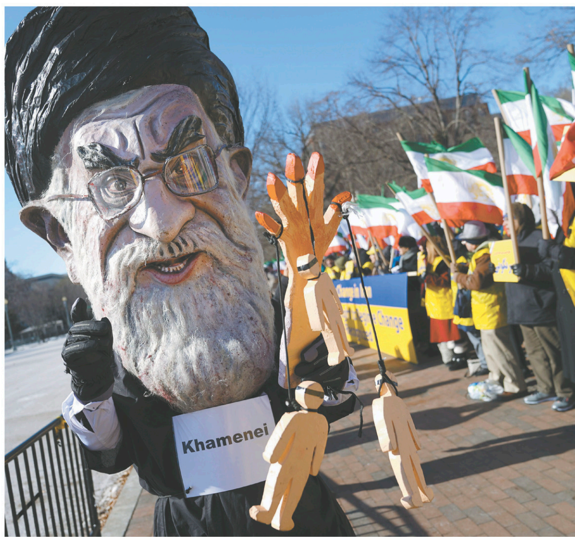
Un manifestant portant un costume à l'effigie de l'ayatollah Ali Khamenei lors d'un rassemblement en appui aux manifestations contre le pouvoir en Iran, devant la Maison-Blanche, le 6 janvier dernier.

C'est aussi Donald Trump qui a promis de détricoter l'accord nucléaire conclu en juillet 2015 entre l'Iran et les Nations unies, un accord porté par le gouvernement précédent de Barack Obama, mais aussi par Hassan Rohani. D'ailleurs, ce dernier a dû défendre cet accord en interne pied à pied contre les conserva-