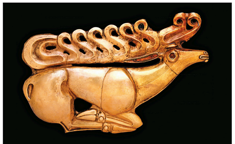
V. TERE BENIN © THE STATE HERMITAGE MUSEUM, ST PETERSBURG, 2017

Cette plaque en or en forme de cerf, mesurant 30 centimètres, est datée de la seconde moitié du VII e siècle avant notre ère. Elle a été découverte à Kostromskaya dans la région du Kouban, au Caucase. Elle est présentement exposée au British Museum.