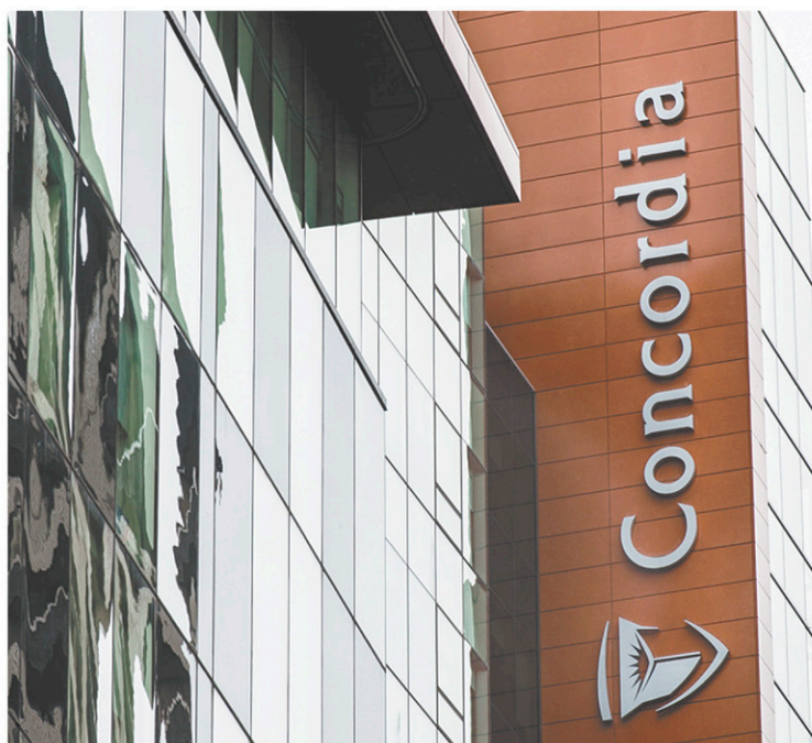
DAVID AFRIAT LE DEVOIR

« Lorsqu'ils étaient rejetés par des femmes, des hommes en position d'autorité ont propagé des rumeurs, dénigré et dégradé celles qui les avaient rejetés », écrit-il.