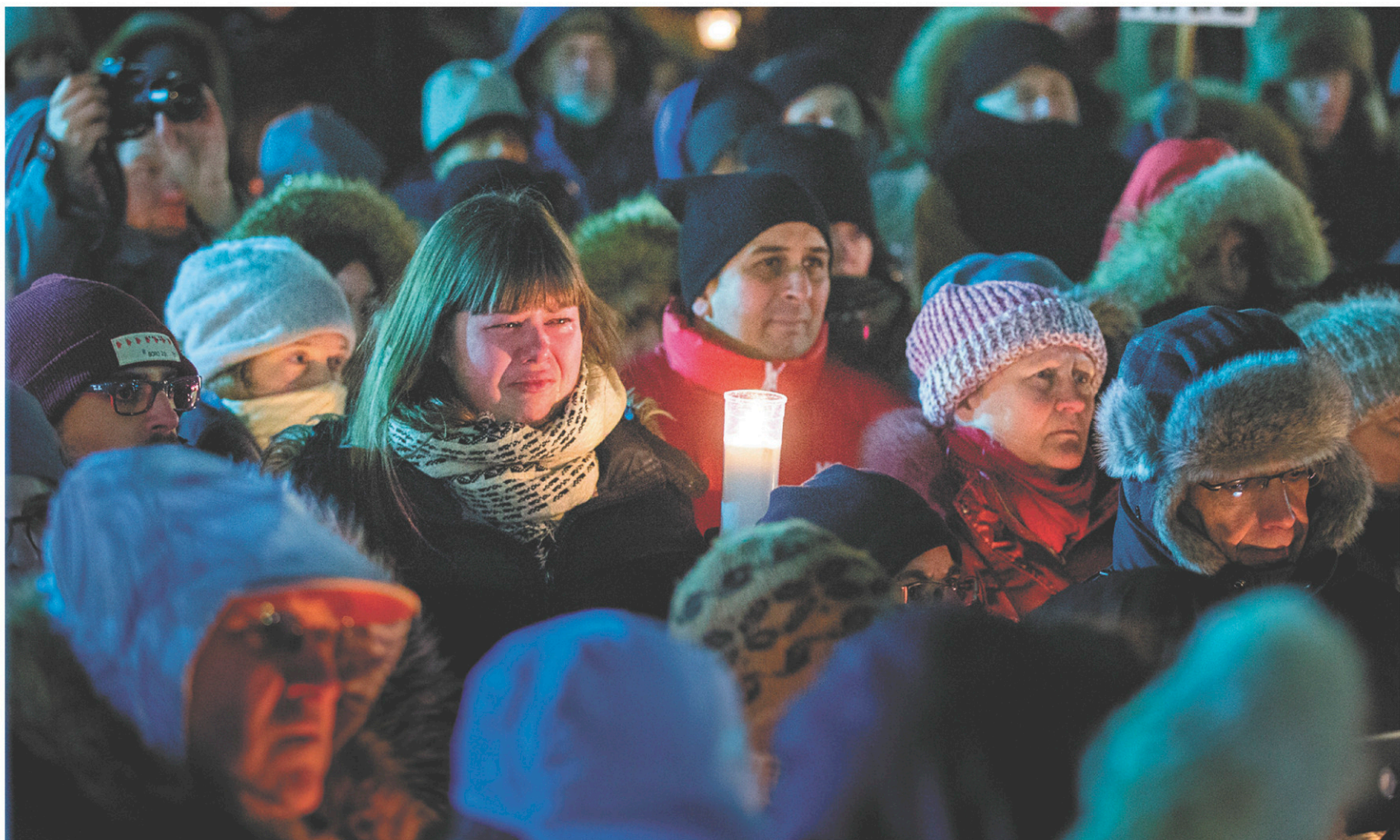
Des centaines de personnes ont rendu hommage aux victimes en participant à des veillées dans les jours suivant l'attaque à la grande mosquée de Québec.

Bref, il ne serait pas surprenant de voir M. Trudeau terminer l'année 2018 là où il l'a commencée : en tête dans les sondages et dans le cœur des Québécois.