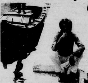
Nanni Loy, autore di numerosi film di successo, tra cui "Debonato in silenzio di giustizia", "Le quattro giornate di Napoli", "Dolce in Italy", sarà a Montevideo per assistere alla proiezione del suo film "Café express" che partecipa al concorso cinematografico del Festival Internazionale. Il film è interpretato da Nino Manfredi. Partito Di Torno ha ritratto il noto regista durante un soggiorno a Venezia.