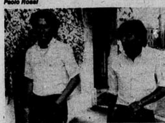
Bruno Giordano, a destra, con Lionello Manfredonia.