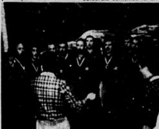
Il coro mentre esegue dei canti di montagna

zione, tenutasi sabato e domenica 2 e 3 agosto all'Hotel Chantecleir di Ste-Adèle. La manifestazione ebbe il suo più alto momento di gloria quando il coro diede inizio ai canti di montagna. La messa celebrata domenica fu un