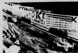
Jabouille taglia vittorioso il traguardo con meno di un secondo di vantaggio su Jones.

Il francese Jean-Pierre Jabouille il volante di una Renault-Turbo ha vinto domenica scorsa il Gran Premio d'Australia formula uno, decima prova del campionato