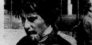
Gilles Villeneuve sembra contrariato, ma il suo ottavo posto va considerato con ottimismo. E chissà che l'avvento della nuova Ferrari-Turbo non gli offra per il prossimo campionato l'occasione sognata. Intanto può consolarsi con il dodicesimo posto del campione Jody Scheckter.