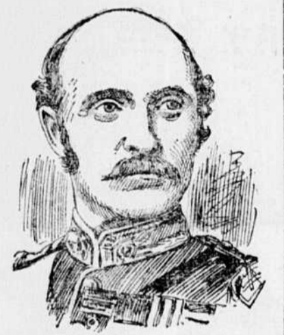
Le général BULLER, commandant en chef de l'armée, envoyé au secours de Ladysmith.