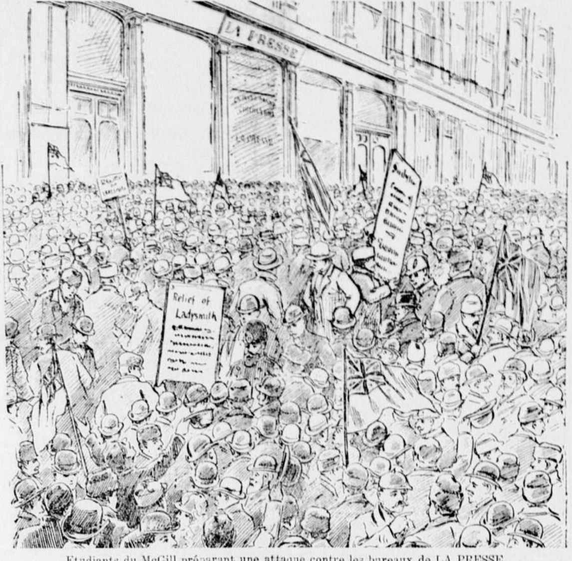
Étudiants du McGill préparant une attaque contre les bureaux de LA PRESSE.

Le drapeau! Le drapeau! vociféraient les étudiants en chœur. Et, sans écouter les sages avis de l'échevin Sad-