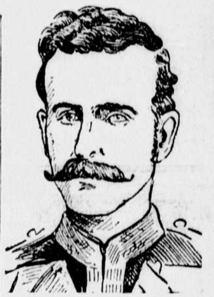
Le général Lord Dundonald, commandant de la brigade de cavalerie, qui a pénétré dans Ladysmith hier soir.

Londres, 1er. — Le bureau de la guerre annonce officiellement, ce matin, que Ladysmith a été délivrée. Londres, 1er. — Le bureau de la guerre a reçu la dépêche suivante du général Buller: "Quartiers généraux de Lyttleton, 1er. — Le général Dundonald, avec les carabiniers du Natal et un régiment mêlé, est entré à Ladysmith hier soir. Le pays entre moi et Ladysmith est, paraît-il, libre de l'ennemi. Je m'avance sur Nelthorpe."