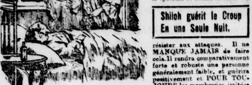
Shiloh guérit le Croup En une Seule Nuit.

Des milliers de personnes ont besoin d'une protection constante, de tous les moments: Nées avec une poitrine étroite, des épaules courbées et une faiblesse corporelle générale, ces personnes sont très sensibles à toutes les variations, un léger courant d'air, les pieds humides, le temps brumeux, les sautes d'humeur leur font contracter un mal de gorge, une toue, et même la pneumonie. Le Remède de Shiloh contre la Congestion et la Toux reconstruit le système et donne la force de