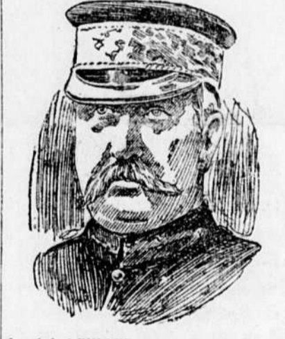
Le général DUNDONALD, commandant de la brigade de cavalerie, qui a pénétré dans Ladysmith.

Lord Dundonald, avec la brigade de cavalerie, a réussi à pénétrer dans la garnison assiégée, hier soir.