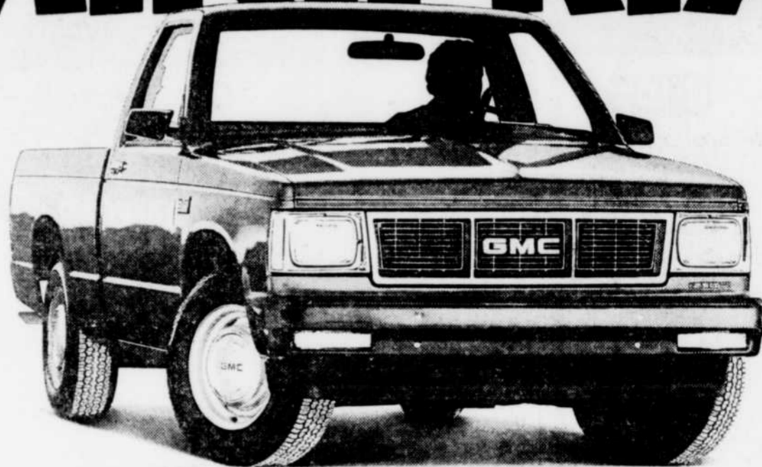
Pick-up compact Prix super-avantageux