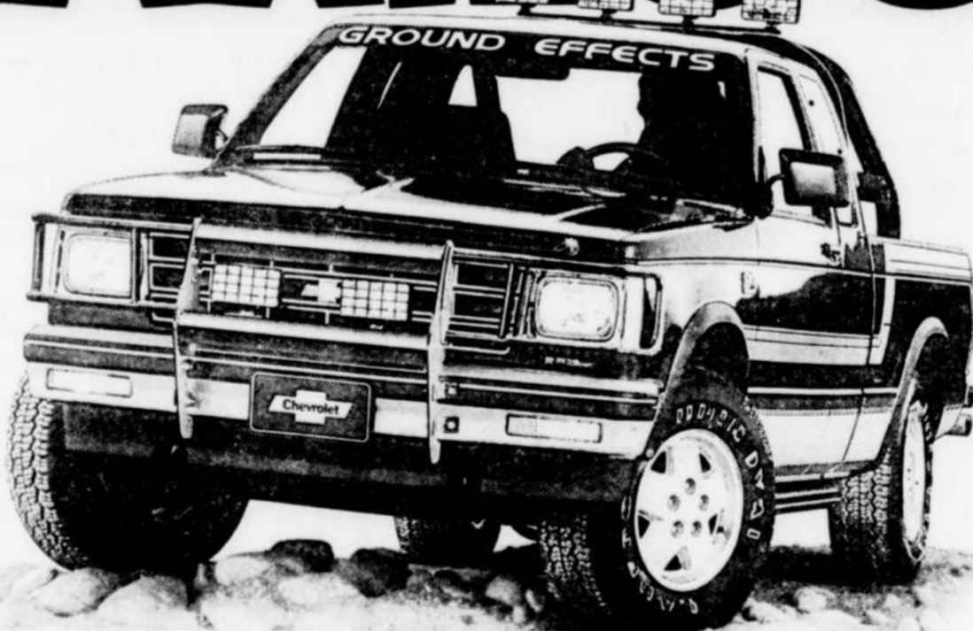
Pick-up compact avec ensemble d'éléments à effet de sol