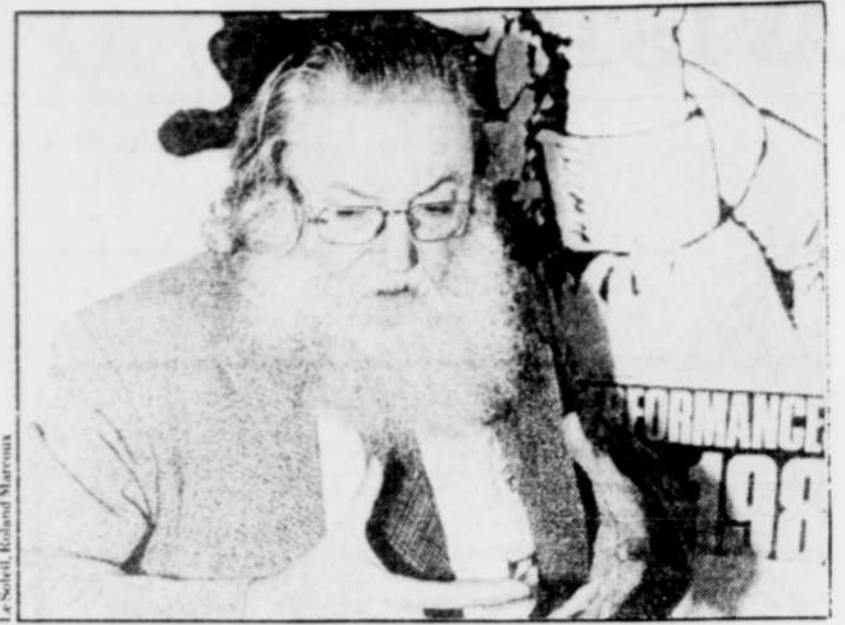
Pierre Restany, important critique d'art français, participe ce soir à une table ronde dans le cadre du festival Immedia Concerto . À Obscure , 21h.

Dans les prochains jours, les occasions ne manqueront pas de vérifier la vitalité de cette autre face de l'art. Le dernier droit de ce festival débute jeudi; on en reparlera.