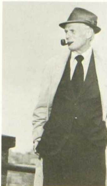
Enquête à Naples

Avant de mourir, Linzza a néanmoins le temps de révéler au détective l'endroit où ses documents secrets sont cachés.