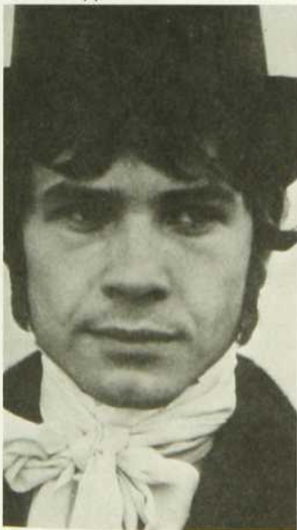
La Cloche tibétaine