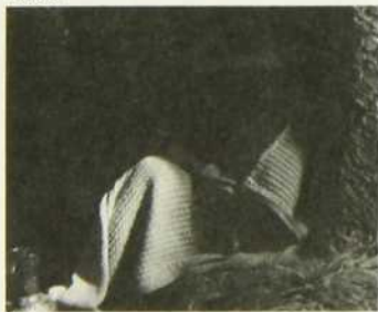
Ascagne et Anchise