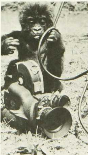
Vivre et survivre

Quant à Ardéchois, coeur fidèle , c'est un feuilleton sur un conflit survenu entre deux clans de «compagnons» au XIXe siècle: les compagnons passants du Devoir et ceux du Devoir de liberté. C'est aussi, à travers le roman de la vengeance d'un homme, la résurrection d'une époque.