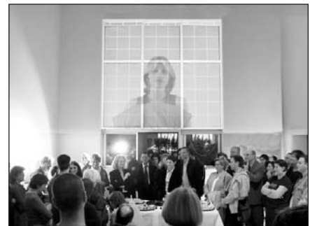
Vernissage de l'exposition «L'effet du logis» lors de France au Québec/la saison.