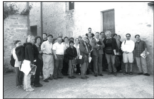
Université d'été sur le Patrimoine