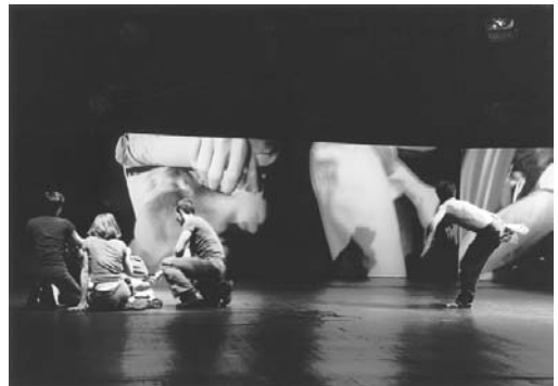
Festival international de danse à Montréal