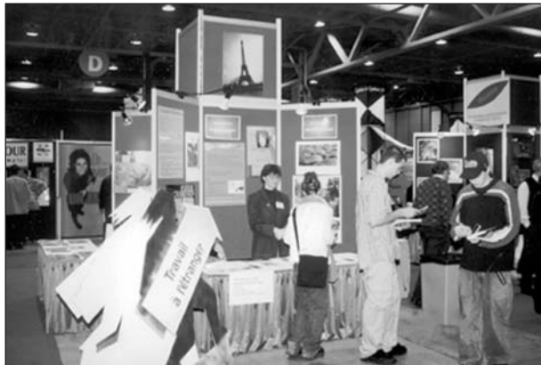
Présence de l'OFQJ aux salons portant sur la formation, l'emploi, les services gouvernementaux.

Un code d'éthique propre aux administrateurs québécois sera adopté lors de prochain Conseil d'administration de l'OFQJ en 2002. D'ici là, le Secrétaire général de l'OFQJ s'assure que les administrateurs québécois se conforment au Règlement sur l'éthique et la déontologie des administrateurs publics tel que stipulé dans le décret du gouvernement du Québec. Aucun manquement au Règlement n'a été observé.