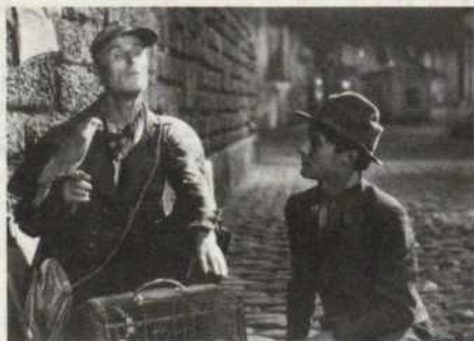
Scènes tirées des «Enfants du paradis» Gaston Modot et Jean-Louis Barrault Dans le cercle: Jean-Louis Barrault et Arletty

Retrouve-t-on cet épanouissement du métier de nos jours? Peut-on comparer le cinéma d'hier à celui d'aujourd'hui?