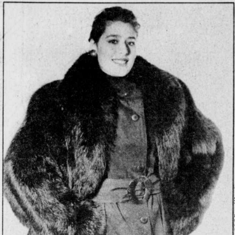
Imper ceinturé à la taille rehaussé d'une veste en renard amovible (Création Jean-François Morissette pour les fourrures Georges Roy).