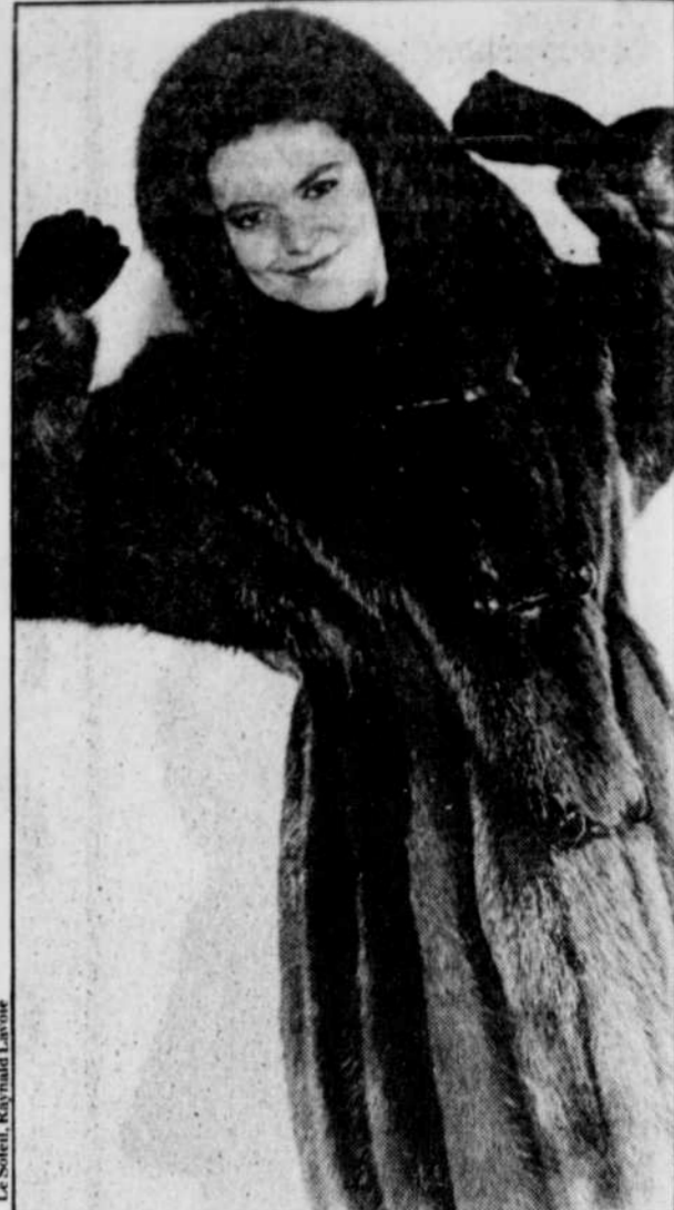
D'inspiration canadienne, un manteau court en castor long poil garni d'un capuchon. (Printemps Fourrures)