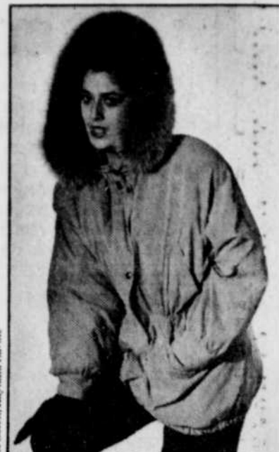
Imper avec surveste en mouton de Perse (Création Jean-François Morissette pour les fourrures Georges Roy, bijoux GarBo).