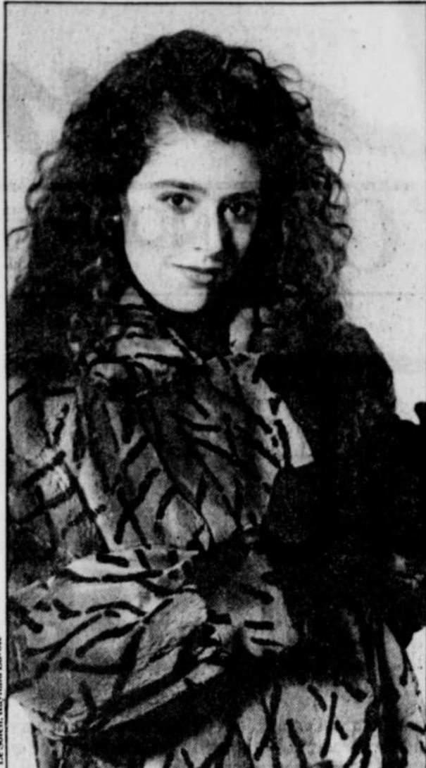
Manteau sport en lapin rasé imprimé. (Laliberté)