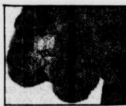
Ci-haut : manchon en cuir imprimé bordé de renard (Laliberté). Ci-dessous : turban-bandeau en vison naturel (Jos Robitaille Fourrures, bijoux Garbo).