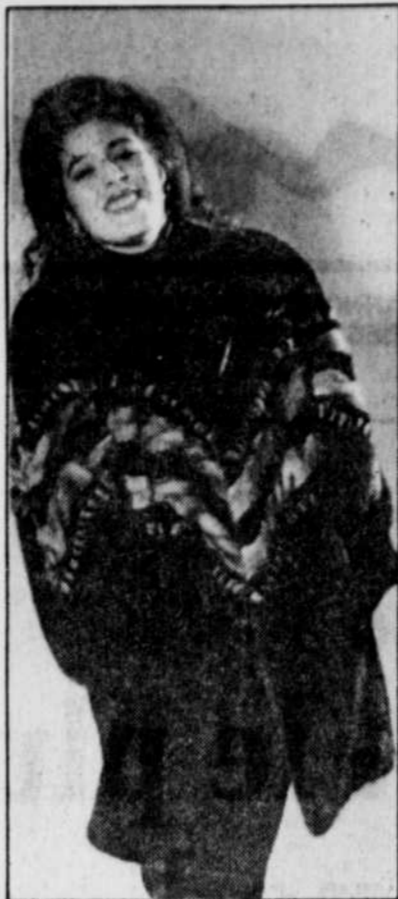
Manteau court en vison travaillé de torsades de vison gris (Laliberté).

On remarque, par exemple, la présence des lignes trapèzes, du col capuchon, des versions blousons ou canadiennes, de l'utilisation des couleurs et des imprimés et l'emploi des fourrures rasées qui permettent plus de souplesse dans les styles et qui sont plus confortables à porter parce que moins encombrantes.