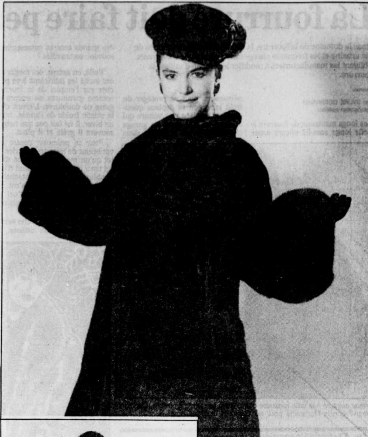
Le Soleil, Reynald Lavigne