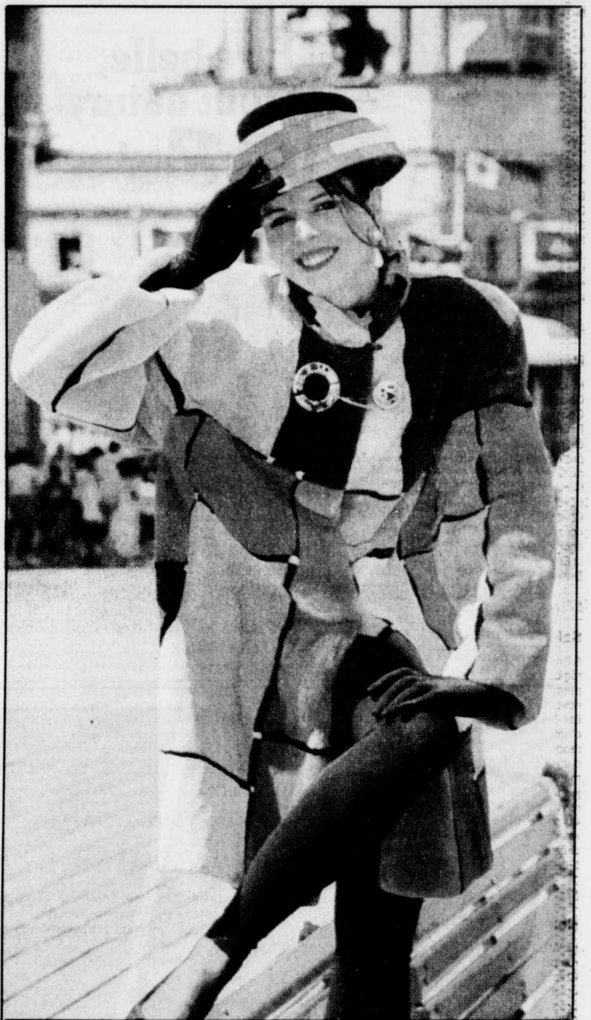
D'inspiration Mondrian, un manteau en castor rasé travaillé d'empiecements de carreaux multicolores. Boutons-bijoux en bois peints à la main. (Collection Zuki, chapeau création spéciale par Philippe Urban pour Kates)

À noter qu'à Québec, il est possible de se procurer les fourrures de Zuki, sur commande spéciale, chez Jos Robitaille Fourrure.