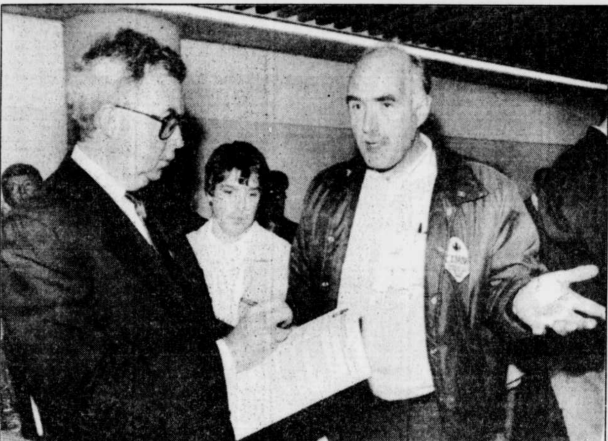
M. Joe Clark, ministre des Affaires constitutionnelles, écoute avec attention un interlocuteur à l'issue de son discours de Vancouver.

«Mais la véritable question est de savoir s'il existe une proposition visant à traiter une partie du pays de façon différente des autres.»