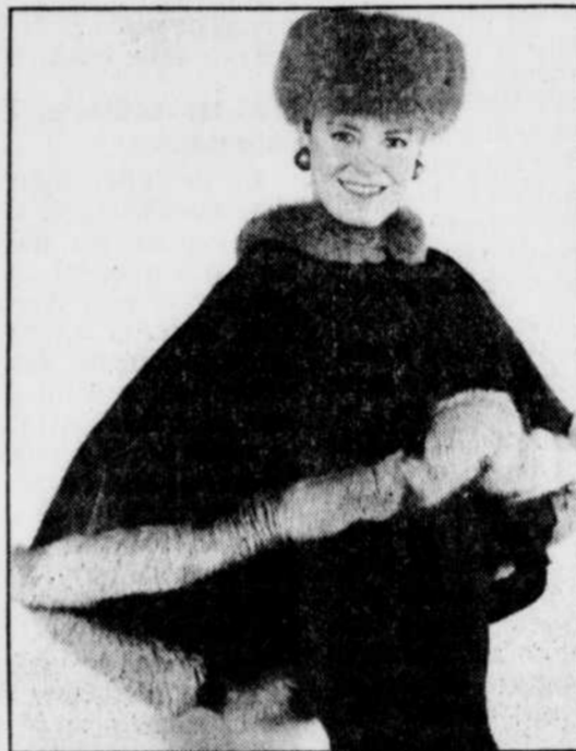
Bandeau et capeline en castor rasé bordée de renard. (Créations Jean-François Morissette pour les Fourrures Georges Roy)