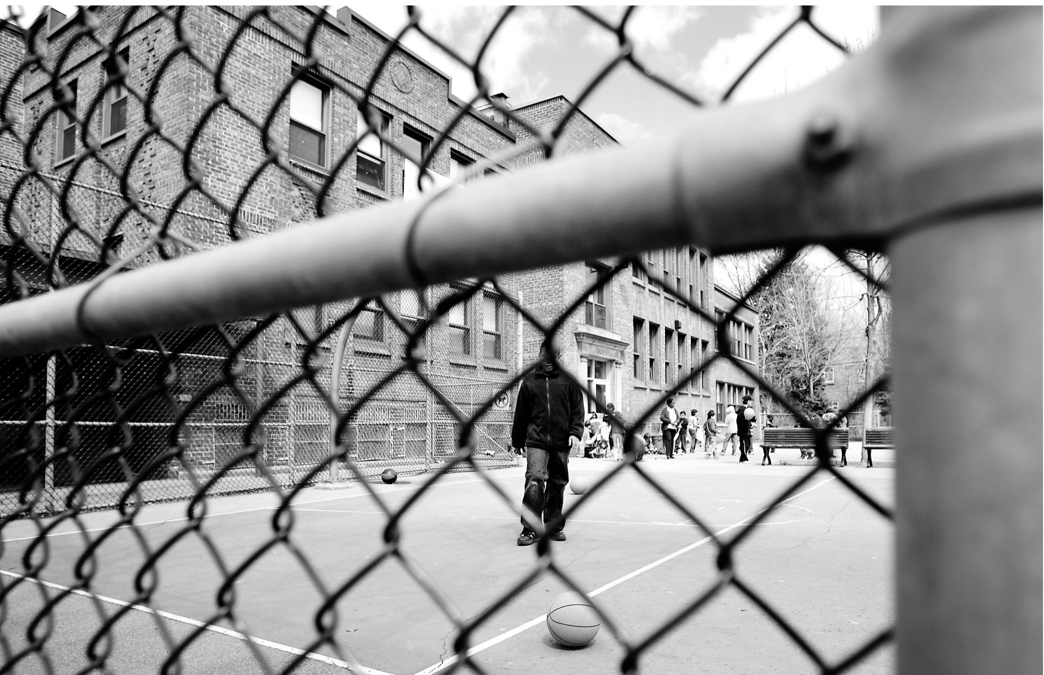
Ahuntsic (notre photo de gauche), a dû rassurer les parents et les élèves de l'établissement.