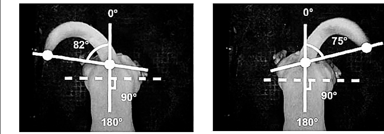
THE CENTER FOR NEUROSCIENCE, UNIVERSITÉ DE TRIESTE

Les chercheurs de l'Université de Trieste, en Italie, ont fait une découverte fascinante sur la queue des chiens. Apparemment, les muscles qui font bouger leur queue sont associés à des émotions — positives ou négatives. Un chien content aura tendance à agiter sa queue davantage vers la droite. En cas de sentiments plutôt négatifs, la queue bougera légèrement plus à gauche. De là à prédire la manière dont les Français voteront dimanche prochain, il n'y a qu'un pas que cette chronique préfère ne pas franchir.