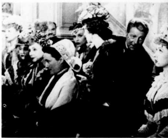
« La Maison Tellier »