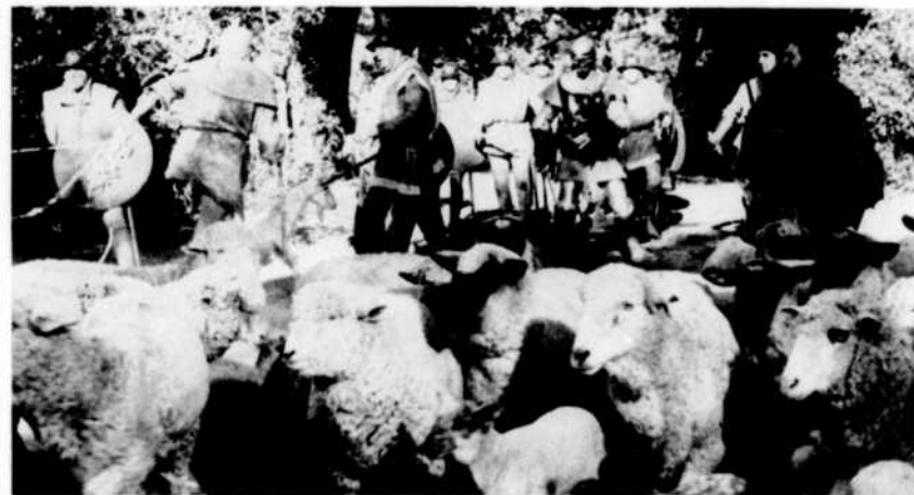
Tous les vendredis après-midi à 5 h. 30, les jeunes et les moins jeunes peuvent vivre les aventures fantastiques d'Ivanhoé, valeureux chevalier du Moyen Âge. L'adaptation pour la télévision du célèbre roman de Walter Scott ne peut manquer de plaire à tous.