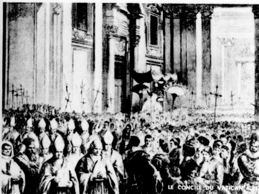
LE CONCILE DU VATICAN