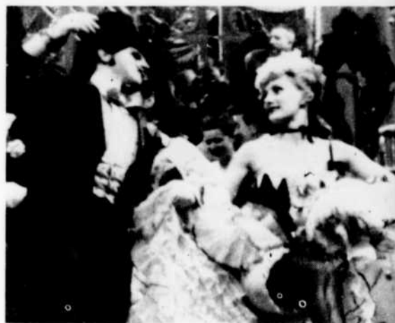
« Le Masque »

La femme, qui a été à l'honneur dans le Rendez-vous de minuit , Cléo de 5 à 7 et Mademoiselle Julie , que les téléspectateurs ont pu voir à Ciné-club depuis quelques semaines, sera de nouveau la vedette de cinq films, parmi les six à venir. En effet, d'autres aspects de l'éternel féminin seront étudiés dans Femmes entre elles (le 23 août), Eve (le 30), les Mauvaises Rencontres (le 13 septembre), les Dames du Bois de Boulogne (le 20), et Hiroshima mon amour (le 27). Le 6 septembre, Ciné-club présentera le Beau Serge .