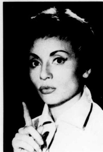
La célèbre fantaisiste Annie Cordy nous invite à nous balader avec elle et ses amis sur la Côte, à l'émission Variétés Côte d'Azur, le dimanche 12 août à 8 heures du soir.

Des circonstances imprévisibles peuvent entraîner des changements après la publication de cet horaire.