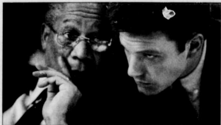
« Je ne prétends pas être Harrison Ford. Je suis un acteur qui a été engagé et qui essaie de faire son travail du mieux qu'il peut », indique Affleck, qui côtoie Morgan Freeman dans « The Sum of All Fears » ( La Somme de toutes les peurs ).

Affleck a eu sa part de mauvaises réactions, plus particulièrement avec le film unanimement critiqué de l'été dernier, « Pearl Harbor », qui a néanmoins connu un bon succès au box-office et sur DVD.