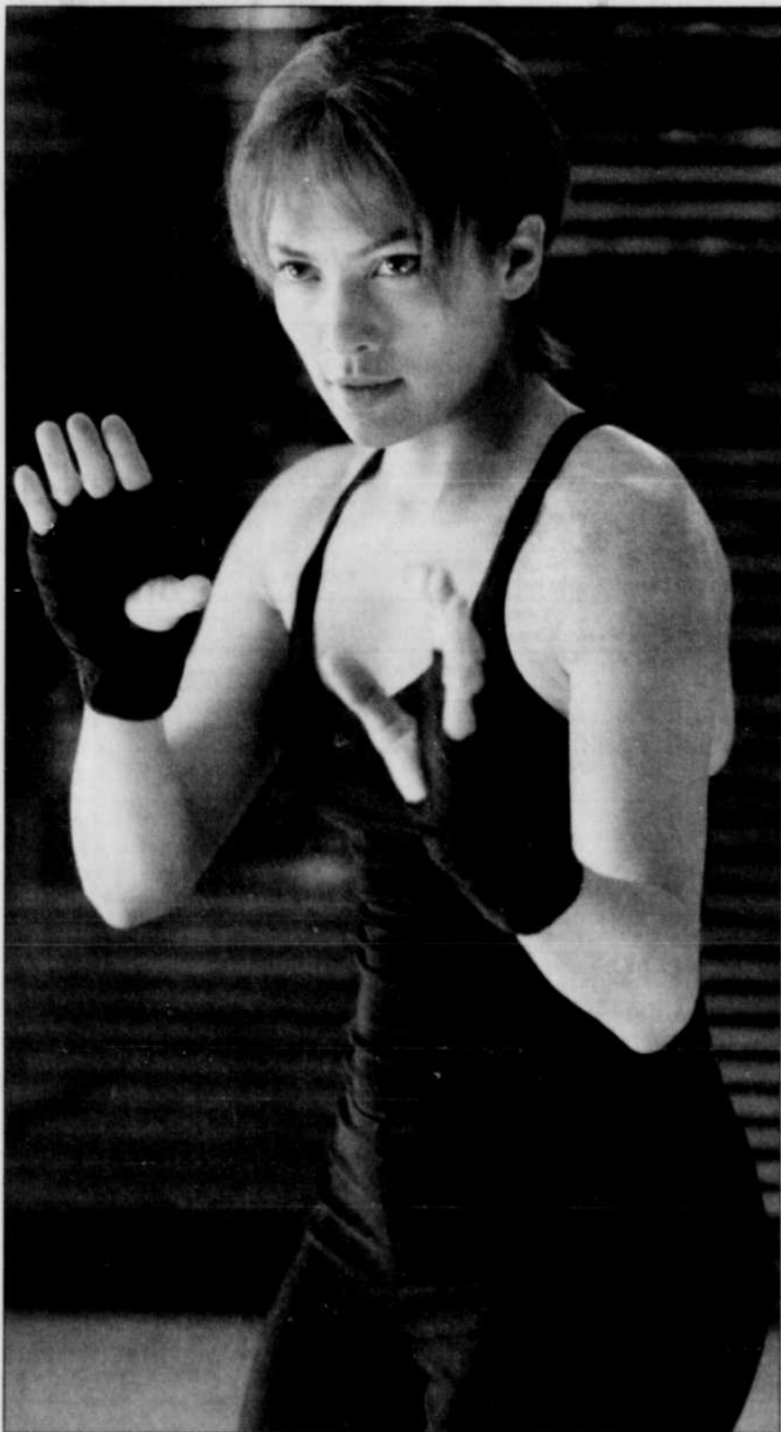
Même si Jennifer Lopez fournit une belle performance sportive dans son combat à mains nues, cela ne suffit pas à racheter ce gros mélo où tous les rôles sont mal écrits et sonnent faux.