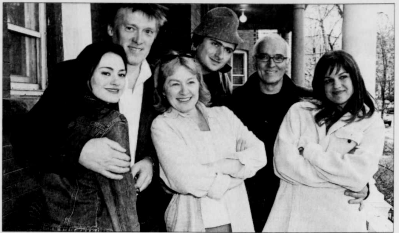
« C'est un film sur les relations hommes-femmes et c'est plutôt pro-femme, croit Micheline Lanctôt, au centre de la photo.