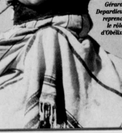
Gérard Depardieu reprend le rôle d'Obélix.

À ce qu'on dit, le tournage de Mission Cléopâtre , effectué au Maroc, à Malte et en France, s'est révélé long et particulièrement fatigant pour l'équipe. Pour le moment, Alain Chabat a l'intention de prendre un peu de vacances. « J'ai des idées de comédie que j'aimerais bien écrire, parce que j'ai envie de tourner, de retrouver les comédiens avec qui j'ai travaillé. »