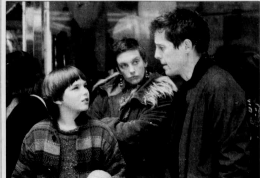
Nicholas Hoult, Toni Collette et Hugh Grant sont les vedettes du film « Comme un garçon ». Cette comédie de mœurs est à l'affiche aux Cinéplex Odéon Beauport, Place Charest et Sainte-Foy et aux cinémas Galeries de la Capitale, Lido et Des Chutes.

CLUB RÉTRODANSE. 4780, ch. Saint-Félix, Cap-Rouge. Danses sociales à 20h30. Entrée: 6$. Inf. 877-2557.