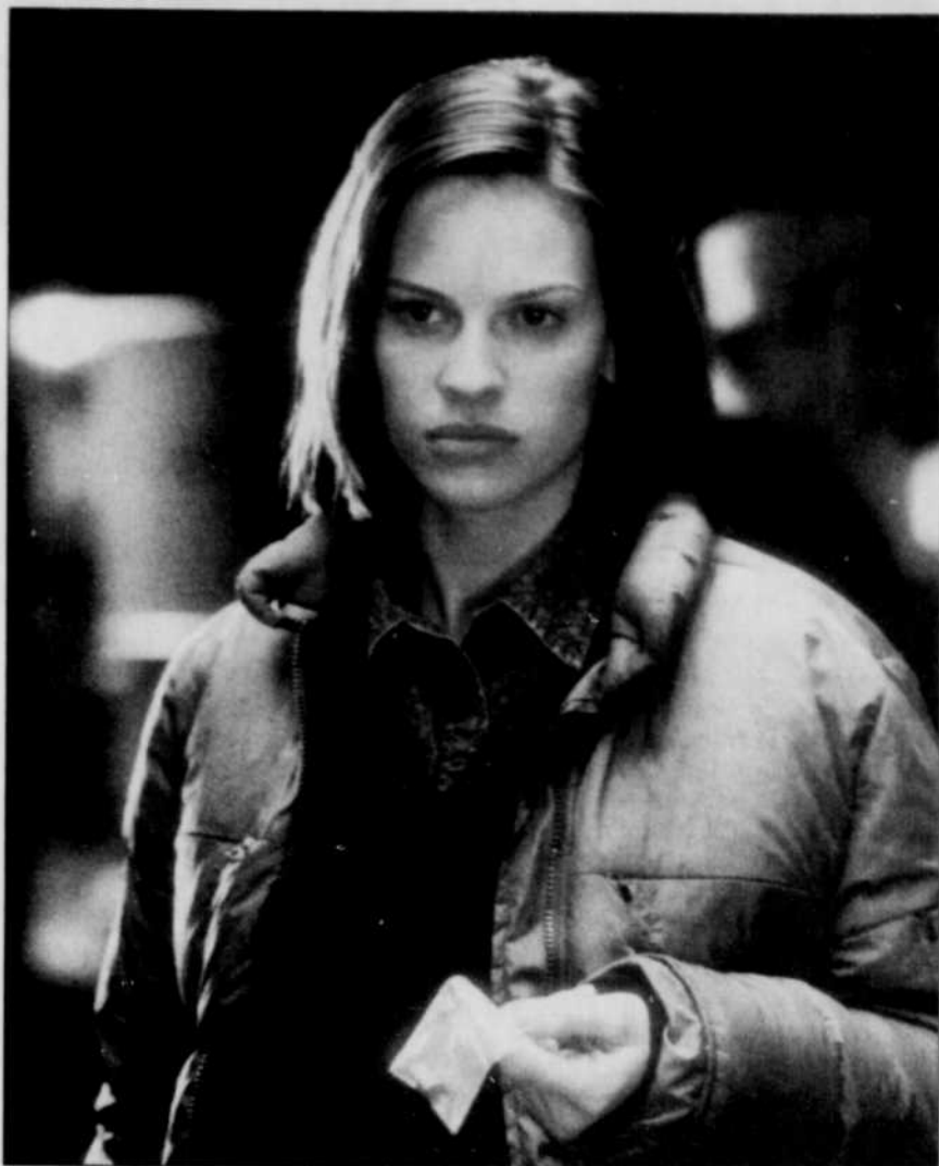
Hillary Swank retrouve sa féminité et sa classe dans le rôle de cette policière attachante, novice mais acharnée.