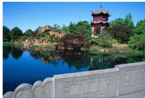
Le Jardin de Chine

À travers la pierre, l'eau et les plantes, qui ont leurs significations, on peut penser aux trois béatitudes chinoises: la chance, la richesse et la longévité qui sont autant de portes d'entrée vers le bonheur. Les points d'eau et les lacs sont omniprésents. Ils réfléchissent comme d'immenses miroirs les teintes vives des fleurs, des rochers et les ombres des huit pavillons construits à Shanghai selon des normes spécifiques pour résister à nos hivers.