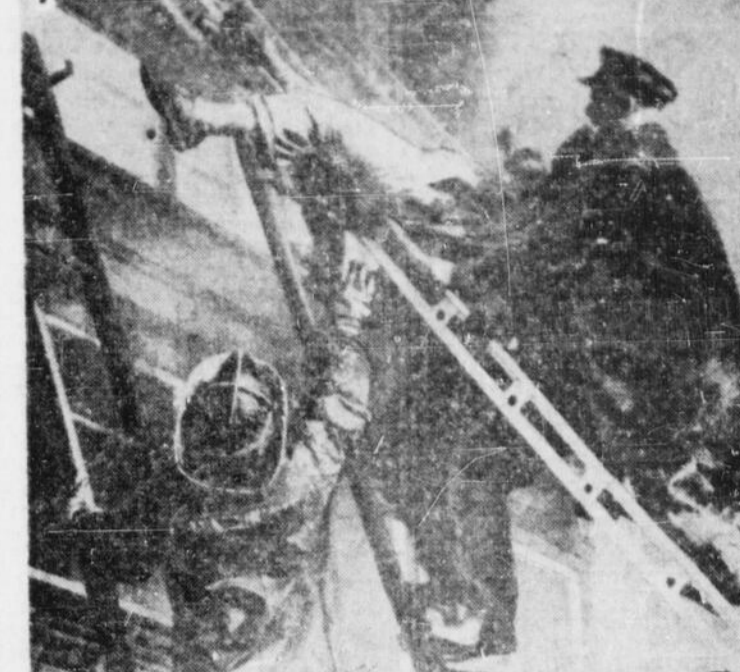
LES POMPIERS DE PHILADELPHIE ont hissé leurs échelles juste à temps pour effectuer ce sauvetage remarquable. Un pompier avait apporté sa caméra lors de ce feu qui avait suivi une série d'explosions dans une usine de la grande ville américaine. Il capta sur le vif cette image d'un homme tombant d'une fenêtre dans les bras d'un pompier. Les secouristes montaient à la rescousse de l'homme lorsqu'il tomba. On ne croit pas que l'incendie ait fait de victimes.