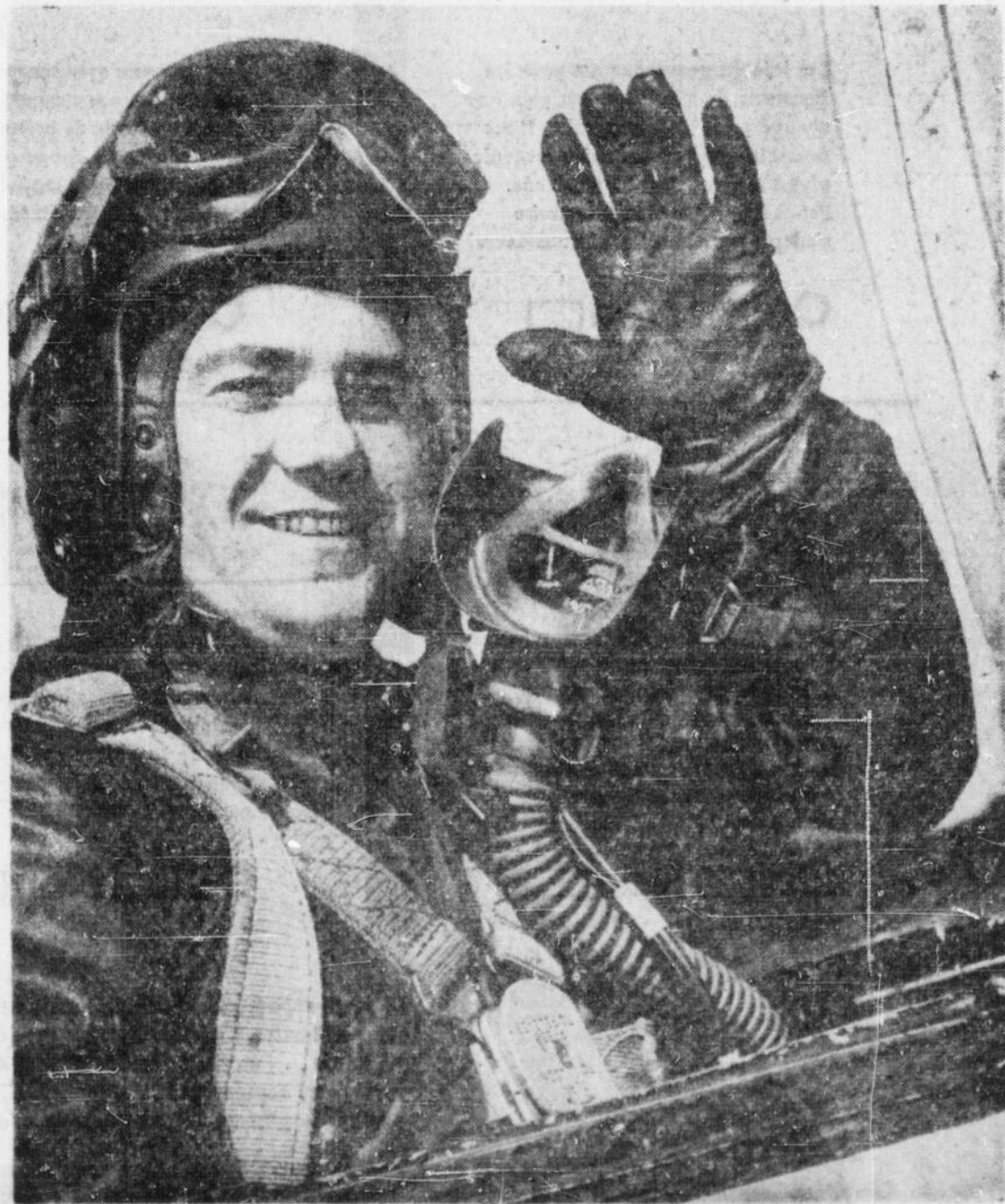
L'ESCADRILLE 416, d'Ottawa, la dernière à revenir d'Allemagne après la deuxième Guerre, se rendra maintenant en France avec l'escadrille 430 de North Bay, et 421, de Saint-Hubert. Avant de remplacer ses avions Mustang par des appareils Sabre à réaction, en mars dernier, le groupe, depuis un an et demi, avait effectué des envolées de démonstration par tout