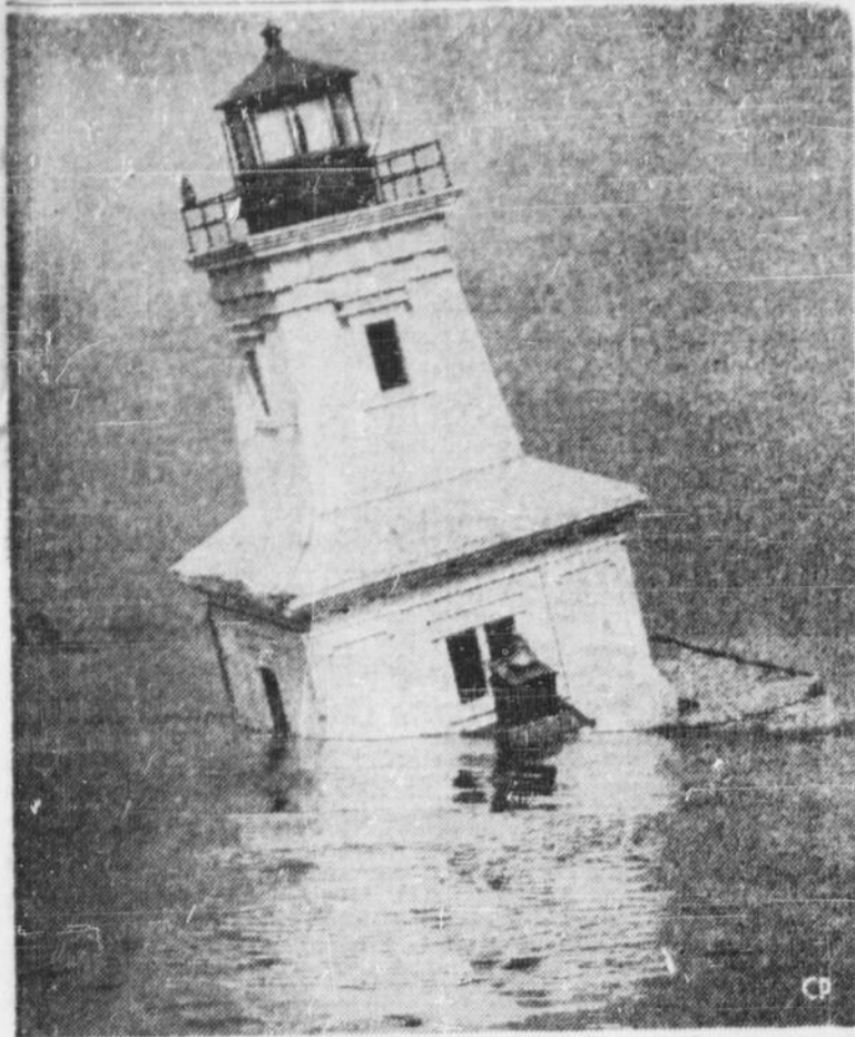
Par une brume opaque, un navire heurte le phare Livingstone, dans la rivière Détroit, près de Windsor, Ont. L'observateur, à son poste au phare, fut projeté à l'eau, mais il parvint à nager au bord, auquel il s'agrippa pour plus d'une heure avant d'être secouru.