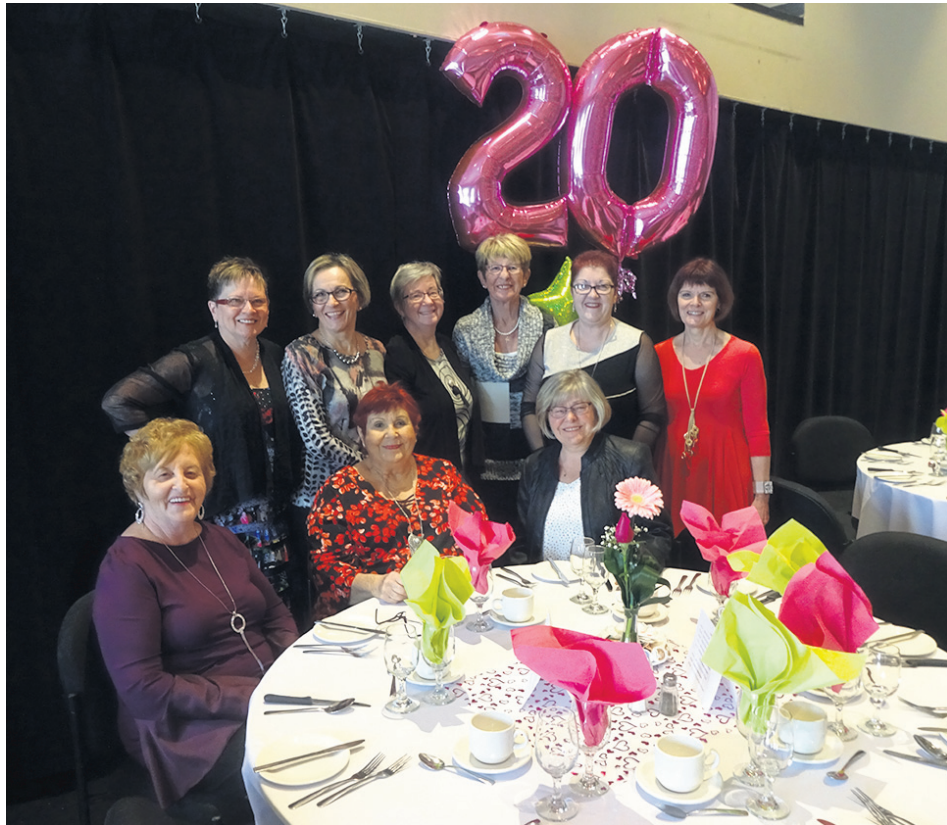
Plusieurs des membres de l'organisme Reflets de femme étaient réunies pour souligner le 20 e anniversaire.

Toutes les membres de l'organisme Reflets de femme étaient conviées en février dernier à un dîner afin de souligner le 20 e anniversaire de l'organisme.