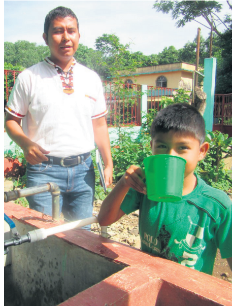
La clientèle de neuf écoles d'El Asintal, au Guatemala, pourra bénéficier d'une eau de qualité.

Avec 4 000 $, les familles relocalisées de la communauté rurale de Santo Domingo Alto, au Pérou, pourront s'approvisionner en