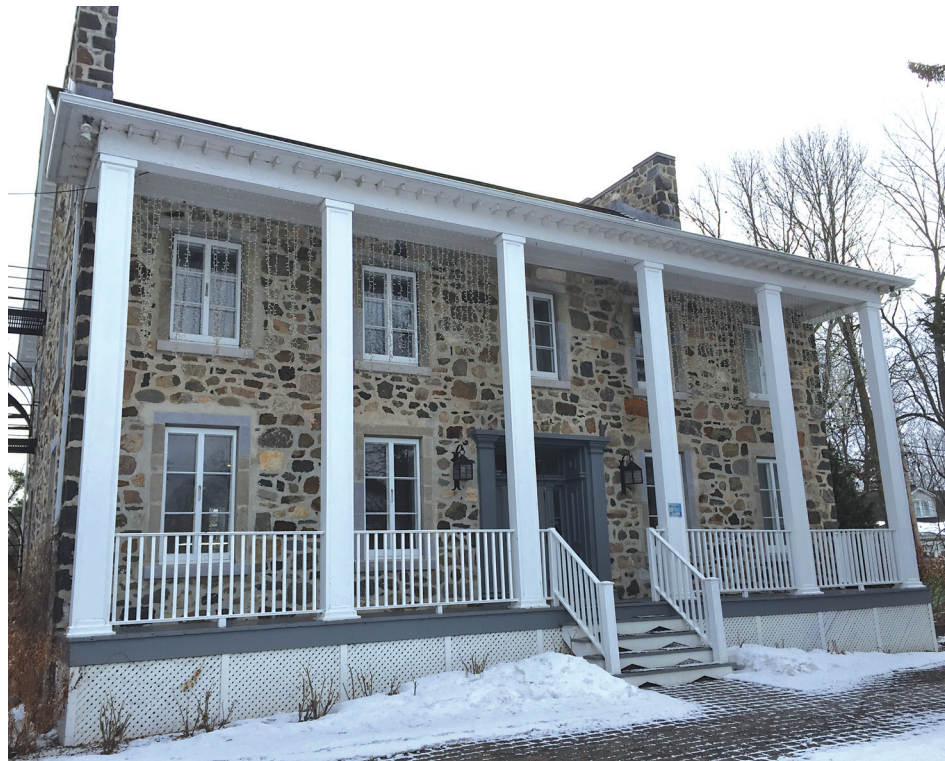
Le Vieux Presbytère recevra des rénovations mineures pendant les prochaines semaines.

« L'objectif qu'on vise avec ces changements, c'est de le rendre plus accessible pour les organismes et c'est aussi pour l'utiliser à d'autres fins que les expositions. » - Martin Murray