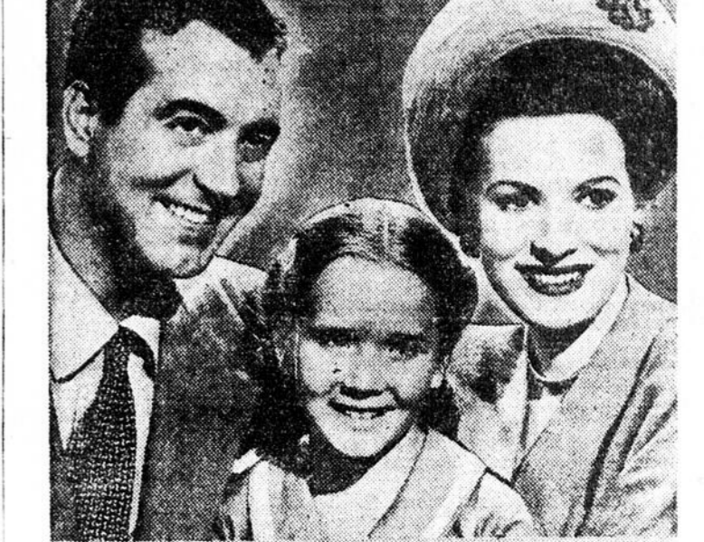
John Payne et Maureen adoptent la petite fille de neuf ans, Connie Marshall dans leur rôle du film à succès "Sentimental Journey" qui met aussi en vedette William Bendix.