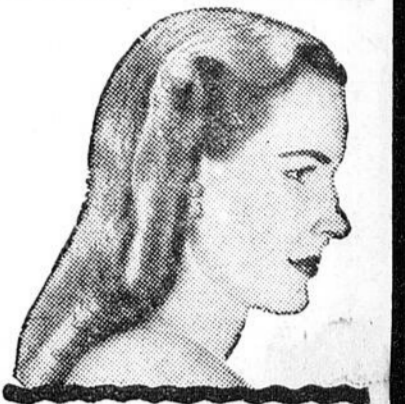
LES BEAUX CHEVEUX ne sont pas une question de chance!

Vous la différenciez que Danderine peut faire - vos cheveux ont plus bel aspect dès la première application.