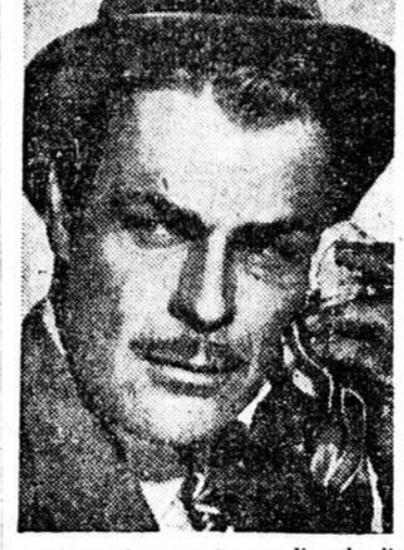
Paul Henreid et Claude Rains dans "Deception".