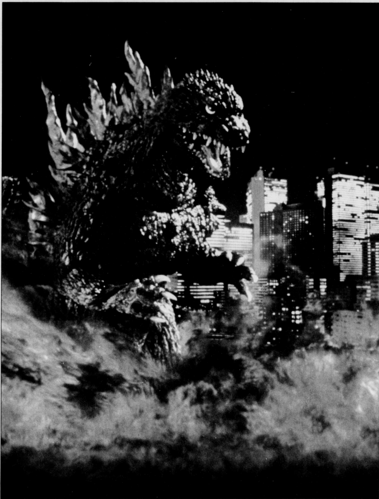
Un reptile-baleine qui écrase de ses immenses pattes les plus hauts édifices... Godzilla est bel et bien de retour!

La première apparition sur les écrans de Godzilla, monstre préhistorique réveillé par les explosions de la bombe H, remonte à 1954. Le nom de Godzilla dans son pays d'origine est Gajira, qui combine les mots japonais pour gorille et baleine.