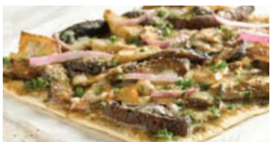
Pizza aux 7 champignons

FAITES VITE ! NOS DERNIÈRES DÉCOUVERTES SONT OFFERTES POUR UN TEMPS LIMITÉ À DÉGUSTER EN SALLE OU À LA MAISON