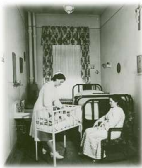
Chambre privée réservée à l'Assistance maternelle de Québec et à des femmes mariées de milieux défavorisés, 1947-1952. (Album 09-45)