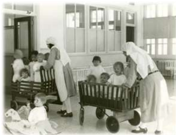
Bonnes poussant des chariots remplis d'enfants, 1932. (PH-G-10,28-12)

C'est au rez-de-chaussée qu'habitaient les plus âgés, afin de pouvoir sortir fréquemment. En effet, à l'extrémité est de la Crèche s'étendait une cour spéciale pour les enfants. Ceux-ci y disposaient de balançoires diverses, de parcs, de glissoires, de tricycles, de voiturettes et de pelles. S'y trouvait aussi un grand kiosque où on leur servait la collation durant la belle saison. En 1967, on construisit même un pavillon muni d'une grande piscine afin qu'ils puissent s'y ébattre. L'hiver, le terrain de jeu s'élargissait. Glissade et pelletage de neige étaient au programme. Plusieurs fréquentaient déjà le jardin d'enfance où ils apprenaient à prier, à parler, à s'habiller, à se moucher... En somme, ce petit monde s'exerçait à la vie. On les emmenait en excursion sur la ferme où la religieuse en charge leur apprenait le nom des animaux, leur utilité, comment distinguer leurs cris. Ils visitaient les jardins, prenaient