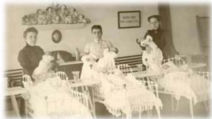
Première crèche à la Maison-Mère, 1901-1902. (PH-G-10,22-01)

Le 2 septembre 1901, le Bon-Pasteur ouvrait donc sa première crèche au rez-de-chaussée de sa Maison-Mère. Ces locaux se révélèrent rapidement inappropriés pour héberger la Crèche. On fit donc l'acquisition, dès la fin du mois, de deux maisons situées près de l'Hospice de la Miséricorde afin d'y transférer l'œuvre de la Crèche. 100 bébés furent donc transportés dans la