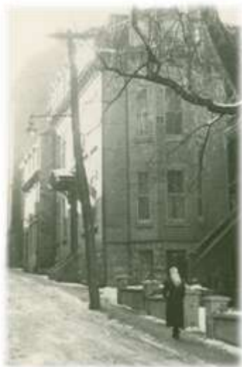
Maison des Saints-Anges sur la rue Ferland, 1902-1908. (Album 21b-20)