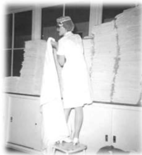
Salle de pliage au 3e étage, s.d. (PH-G-10,28f-05)