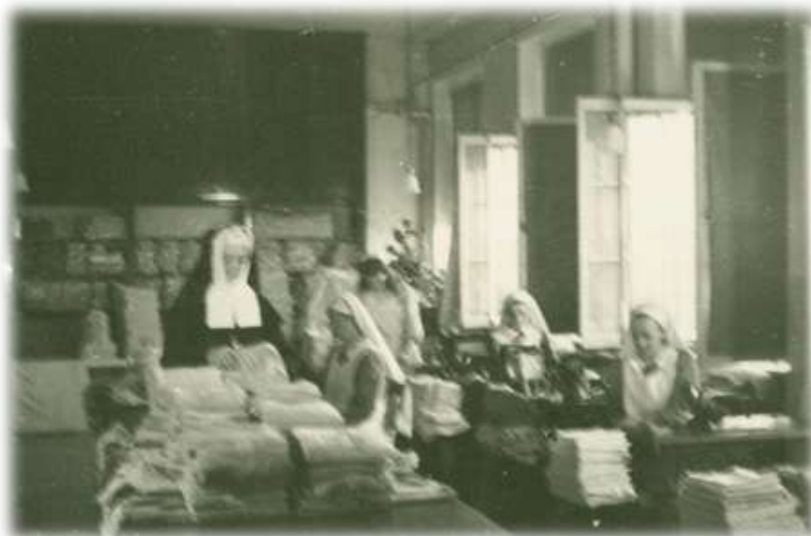
Lingerie des enfants, s.d. (Album 21a-13)

La lingerie des enfants était un autre office important où se faisait la couture et le raccommodage. C'est par centaines que s'y confectionnaient draps, laizes, couvre-pieds, fourreaux de matelas, linges à vaisselle, essuie-mains, sacs à linge, etc... Mine de rien, 600 sacs en usage régulier exigeaient une réparation de 150 à 175 chaque semaine. Pendant nombre d'années, ces sacs ont été faits de coupons de tissus variés. S'imagine-t-on le temps consacré à l'agencement de ces multiples couleurs, afin de présenter un travail convenable ? Un autre détail d'apparence insignifiante, mais qui réclamait une ouvrière à longueur de semaine, était la réparation des ganses en coutil de vieux matelas, des galons, des boutons et des boutonnières. La première partie de la semaine était consacrée à la confection du neuf, et la seconde, à la réparation du linge rentrant du blanchissage. La lingerie renvoyait aux quatre départements : habits, salopettes, robes, chemises, bonnets, draps et piqués, en nombre variant de 100 à