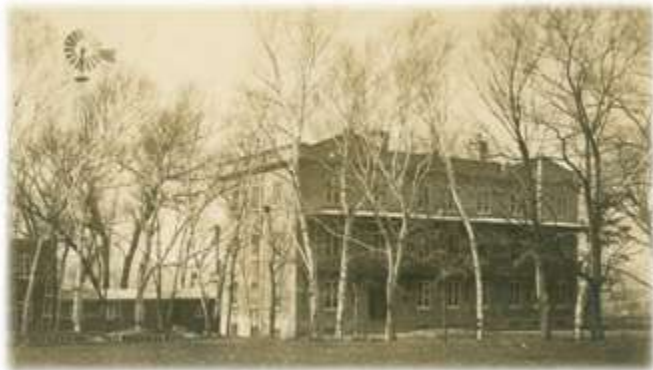
Hospice Saint-Vincent-de-Paul, 1908. (PH-G-10,1-01)

Le 6 juillet 1908, les 125 protégés de la Crèche émigrent dans les nouveaux locaux situés sur le Chemin Sainte-Foy. L'institution prit alors le nom d'Hospice Saint-Vincent-de-Paul en l'honneur de sa première directrice. Victime d'un important revers de fortune, le Chevalier Robitaille ne put fournir l'assistance à laquelle s'attendait le Bon-Pasteur, ce qui obligea donc la congrégation à assumer elle-même des frais inattendus. La pauvreté qu'on croyait avoir semée sur la rue Ferland reprenait rapidement du terrain. On avait cru régler le problème de la surpopulation, mais on dénonce déjà l'encombrement moins d'une année après l'arrivée dans les nouveaux locaux. En mai 1909, on compte 107 bébés sur les deux étages de la Crèche. Le problème s'aggrave jusqu'en 1915, où on atteint le nombre de 181 enfants, tous logés dans un espace que les médecins estiment pouvoir contenir entre 60