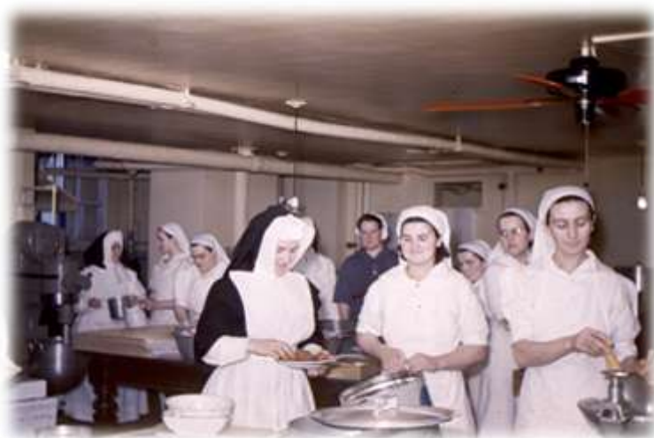
Cuisine de la Crèche, vers 1940. (D-10,09-24)

connaissance des divers légumes et y goûtaient, cueillaient des fleurs qu'ils apprenaient ensuite à nommer... Lorsque les enfants avaient atteint un certain âge, on les dirigeait à l'École Maternelle de Neuville afin qu'ils puissent y poursuivre leur cheminement physique et moral. Il arrivait toutefois que certains soient envoyés dans des institutions spécialisées, lorsque leur développement intellectuel l'imposait.