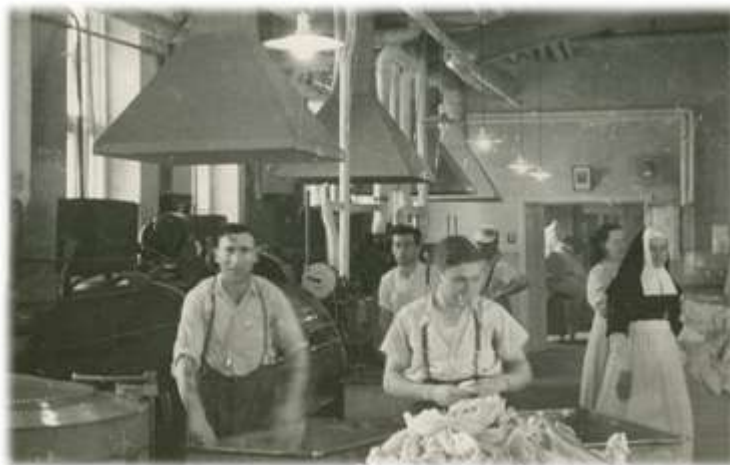
Buanderie de la Crèche, s.d. (Album 21a-11)

De ce pas, continuons jusqu'à la buanderie. Encore un endroit de grand dévouement ! Cinq hommes et neuf filles s'y activaient sous la surveillance d'une religieuse. Des monceaux de linge y arrivaient chaque jour pour y subir blanchissage et calandrage. Chaque enfant possédait sa propre lingerie marquée afin d'éviter la contagion. Tout devait retourner avant la nuit aux départements respectifs, tant de l'Hôpital de la Miséricorde que de la Crèche. Il en était ainsi du lundi matin au samedi soir. En complément, une religieuse et quatre filles s'employaient à la repasserie, debout à longueur de semaine, sur trois presses et au fer, à repasser le linge qui nécessitait un traitement plus soigné.