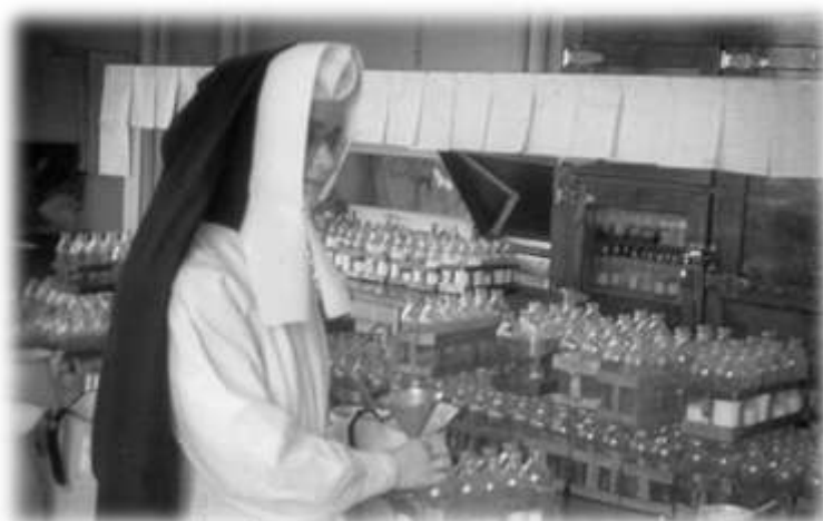
Sœur à la biberonnerie, s.d. (D-2,4-04)

refroidissements pouvaient apporter toutes sortes de complications, tant du côté des oreilles que de la gorge et des voies respiratoires. L'enfant, bien lavé, était asséché, poudré et pesé chaque jour; son poids était noté sur une fiche à cet effet. Enfin, on l'habillait et on le remettait dans son lit. Si c'était dimanche ou jour de fête, ou si l'on prévoyait une visite extraordinaire, le bébé était mis en toilette. En attendant son biberon, il caressait un jouet, suivait du regard sa gardienne, s'examinait les mains, exécutait des vocalises, selon qu'il était ou non de belle humeur.