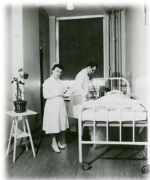
Examen d'une parturiente dans une salle d'isolement du 2 e étage, vers 1949. (Album 09-09)

Après leur admission à l'Hôpital de la Miséricorde, les jeunes filles devaient subir un examen médical complet. Elles revenaient ensuite à la consultation au moins une fois par semaine jusqu'à leur accouchement. Peu importe à quelle époque les mères étaient hospitalisées, elles bénéficiaient toujours de soins médicaux modernes et à la fine pointe de la science. Des soins particuliers étaient prodigués en rapport aux besoins de chacune. Contrairement à une croyance populaire, au moment de l'accouchement, rien n'était épargné pour réduire les souffrances et offrir le plus de confort possible aux patientes. Obstétriciens, anesthésistes, chirurgiens et infirmières diplômées s'affairaient à leur chevet et étaient prêts à faire face aux conditions difficiles. Les mères se savaient donc entre bonnes mains. Des étudiants en médecine de l'Université Laval assistaient aussi à bon nombre d'accouchements et bénéficiaient ainsi d'une expérience pratique très précieuse. Dès sa naissance, l'enfant était conduit à la Crèche où un berceau l'attendait. La convalescence de la mère durait le temps qu'il fallait et dans les meilleures conditions. Certaines retournaient toutefois dans leur famille après quelques jours seulement.