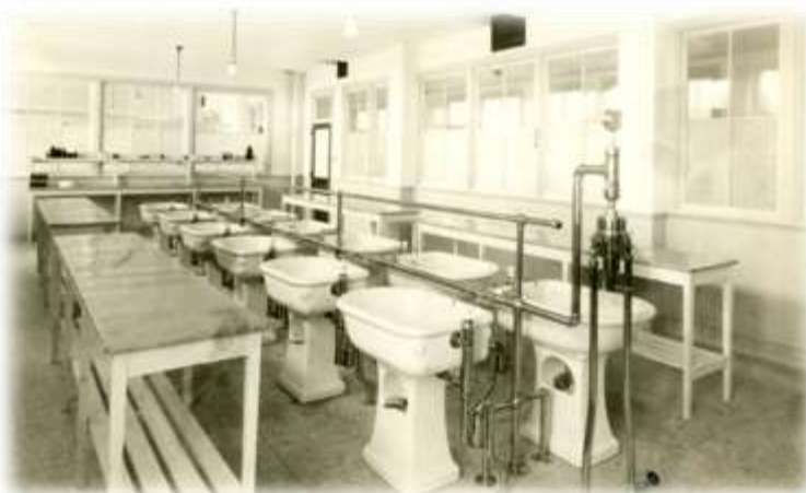
Salle des bains, 1930. (PH-G-10,8-02)

Attention d'abord, aux courants d'air ! Car les