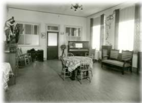
Salle familiale des semi-privées au 3 e étage, vers 1949. (PH-G-3,40-09)

Pendant les semaines, voire les mois, qui précédaient leur accouchement, les protégées de l'Hôpital de la Miséricorde n'étaient pas confinées, comme certaines personnes aimaient à le laisser croire, à une vie austère de privation et de pénitence. Elles ne venaient pas à la Miséricorde pour être jugées et punies, mais pour y recevoir soutien et compassion. Néanmoins, afin de maintenir un certain ordre, un règlement était imposé aux protégées de la salle commune. L'heure du lever dépendait de l'audition facultative de la messe à 6h30 et les repas étaient pris en commun. Pour celles qui étaient en état de les fournir, l'établissement réclamait environ cinq heures de travaux quotidiens, comme l'entretien de la maison, la