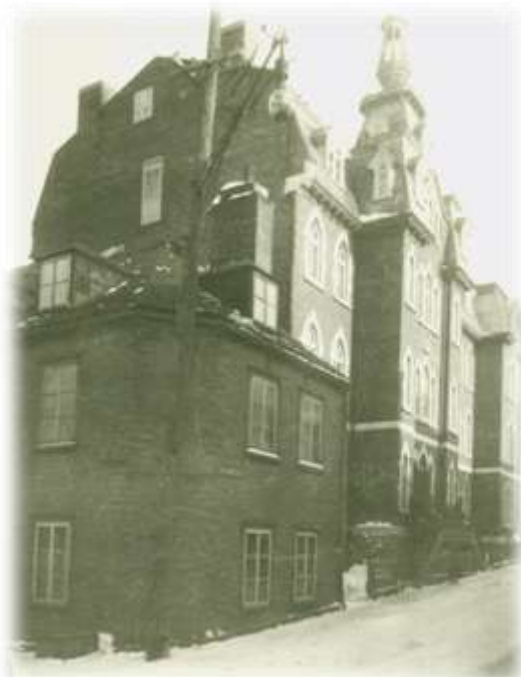
Hospice de la Miséricorde de 1874 à 1929 (PH-G-10,65)