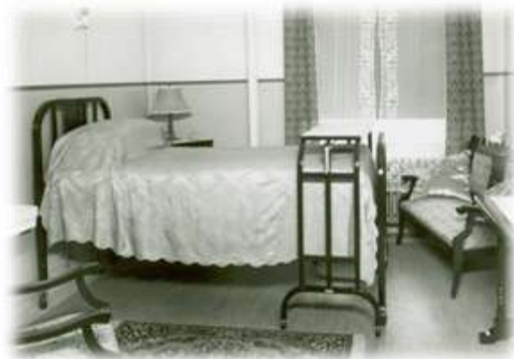
Chambre privée au 3 e étage de l'Hôpital de la Miséricorde, s.d. (Album 09-17)

Le 2 e étage était affecté au service médical. On y retrouvait le bureau et la chambre du médecin en chef ainsi que de son assistant. Un médecin résident et un interne, également logés, étaient de garde jour et nuit afin de répondre aux besoins de toutes les patientes hospitalisées. Un dortoir et une salle étaient destinés aux stagiaires, étudiants en médecine de 4 e année.