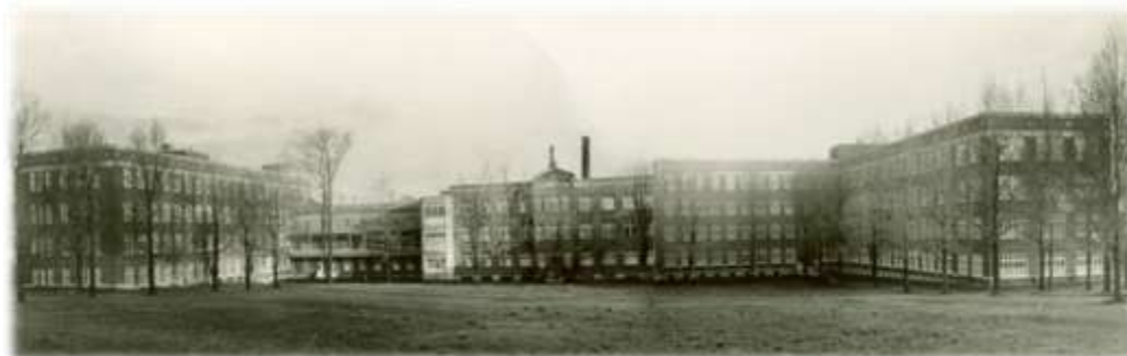
Complexe de la Crèche Saint-Vincent-de-Paul, 1929. (PH-G-10,3-03)

Le nombre de naissances illégitimes étant loin de régresser et la Maternité de la rue Couillard ne suffisant plus à la demande, on songe à transférer les mères célibataires à proximité de la Crèche. En 1927, on commence la construction de deux nouvelles ailes au bâtiment du Chemin Sainte-Foy : l'une hébergera les enfants de la Crèche et la seconde l' Hôpital de la Miséricorde . Inaugurée en 1929, cette construction à l'épreuve du feu a été dotée d'équipements médicaux modernes, de laboratoires, de cliniques, de solariums, d'une ventilation spéciale et de tout l'équipement spécialisé nécessaire au soin des enfants. Cet agrandissement permettait dorénavant l'hospitalisation de 640 enfants. Toutefois, dès l'automne de la même année, la population infantine fit un bon de 496 à 693 en raison de l'arrivée