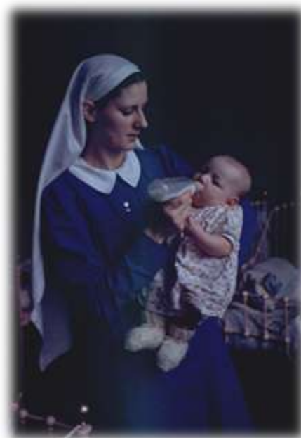
Une Marguerite, ou bonne, s.d. (D-10,09-58)

Dès la fondation de l'œuvre en 1901, les religieuses du Bon-Pasteur firent don de leur personne, de leur temps et de leur dévouement au service de l'enfance malheureuse. Elles s'efforcèrent toujours de combler une absence par leurs gestes maternels. Toutefois, elles n'avaient d'autres choix que de s'adjoindre l'aide de laïques pour parvenir à gérer les besoins de toute la population infantine qui leur était confiée. Les filles de l'Hospice de la Miséricorde furent donc mises à contribution rapidement. Certaines de celles qui devaient offrir quelques mois de service à la Crèche afin de couvrir les frais de leur séjour à la Maternité décidèrent même de former une association, en 1905, afin de se vouer aux tout-petits pour une période plus longue. Celles-là portaient le nom de Marguerites du Sacré-Cœur . Toutefois, au quotidien, associées ou non, elles portaient le titre de « bonnes ». Et c'est leur dévouement obscur et leur labeur constant qui assurèrent à la Crèche la main-d'œuvre indispensable sans laquelle elle n'aurait pu subsister. Elles étaient soutenues par le zèle et la bonté des religieuses qui s'activaient dans l'ombre à maintenir en mouvement les rouages d'une entreprise humainement impossible.