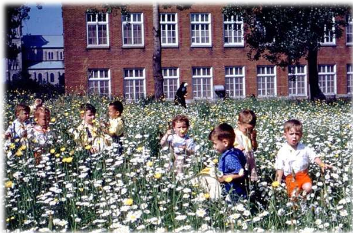
Enfants cueillant des fleurs devant la Crèche Saint-Vincent-de-Paul, vers 1955. (D-10,09-168)

Quant à lui, Mgr Victorin Germain poursuivit son œuvre en faveur de la Crèche jusqu'à son décès en juin 1964. C'est avec une reconnaissance infinie qu'on lui attribuait, directement ou indirectement, plus de 20 555 adoptions.