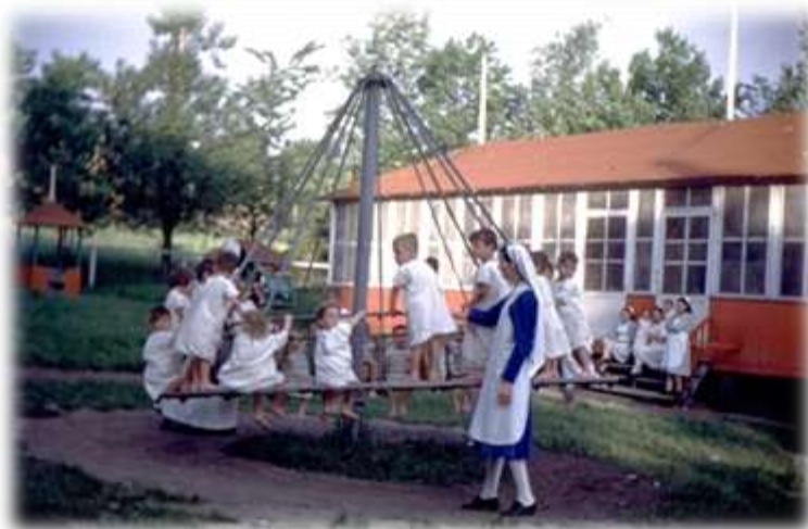
Enfants s'amusant sur le carrousel poussé par une bonne et une religieuse, s.d. (D-10,09-171)