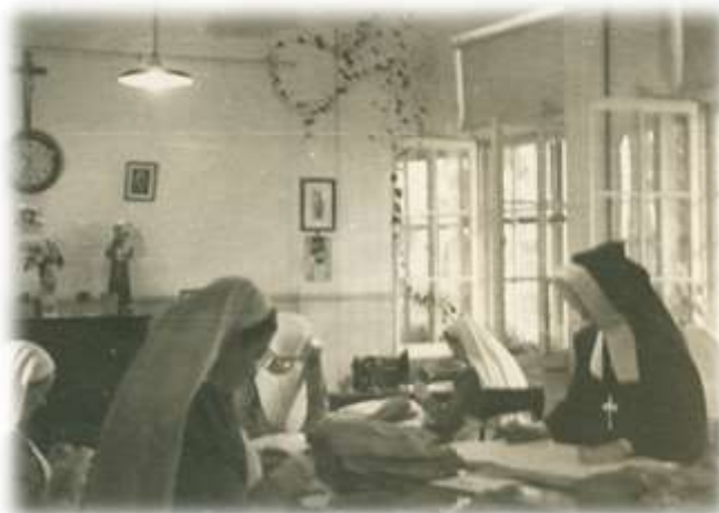
Lingerie des bonnes , s.d. (Album 21a-15)

Voyons maintenant ce que comprenait une journée à l'œuvre auprès des enfants. Retournons chez les nouveau-nés. Leur soin nécessitait de multiples attentions. À 7h du matin, la journée commençait au pied de l'autel et se continuait auprès des tout-petits, pures images de l'Enfant-Dieu qui regardait comme fait à Lui-même ce qui était fait au moindre de ces pauvrets. Chacune avait sa part bien déterminée et tout marchait rondement.