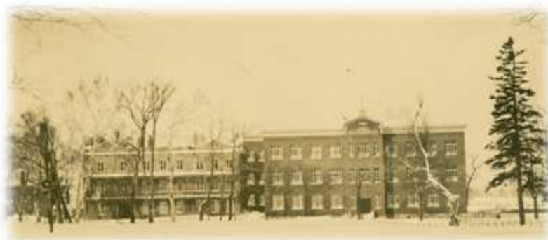
Crèche Saint-Vincent-de-Paul, 1916. (PH-M-7,22-02)

Encore une fois, c'est la charité privée qui financera la nouvelle construction entreprise en 1915, que ce soit par le biais de la commandite de Berceaux, de dons substantiels ou d'initiatives des Dames patronnesses. Le nouveau bâtiment était inauguré par les 300 enfants de l'œuvre en 1916 et porterait désormais le nom de Crèche Saint-Vincent-de-Paul .