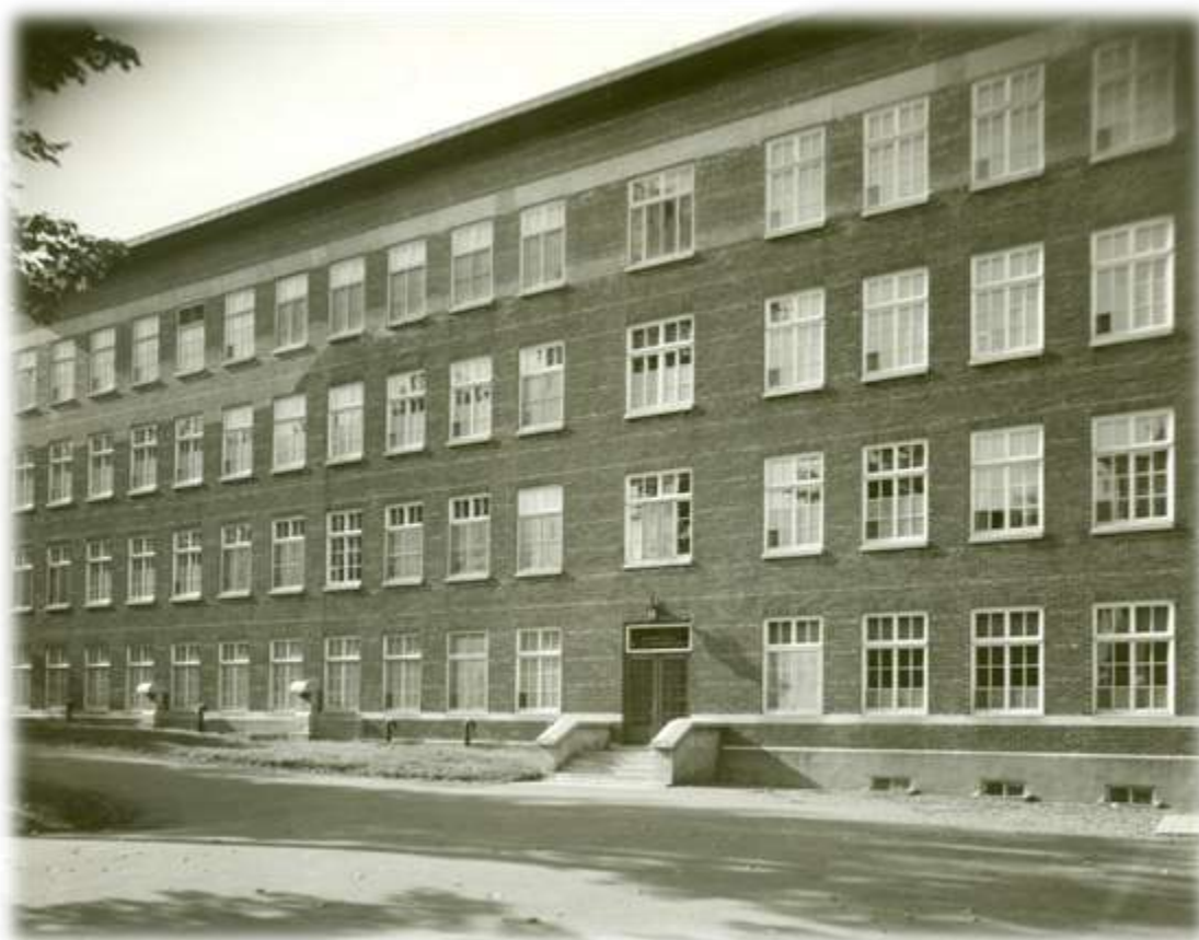
Hôpital de la Miséricorde, 1929-1972 (PHG-3,39-01)

C'est ainsi que, de son ouverture en 1874 jusqu'à sa fermeture à la fin décembre 1972, l'Hôpital de la Miséricorde avait enregistré 46 122 admissions et 36 780 accouchements.