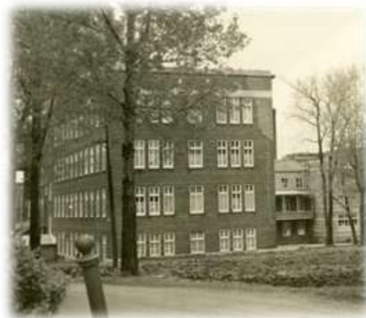
Hôpital de la Miséricorde dans le complexe de la Crèche Saint-Vincent-de-Paul sur le Chemin Ste-Foy, 1929-1972 (PH-G-3,39-02)

Le terrain du Chemin Sainte-Foy étant d'une dimension appréciable et profitant de l'air sain de la campagne, puisque cette partie de Québec était à cette époque un milieu agricole, on commence à songer vers 1925 à y transporter l'Hospice de la Miséricorde. On commence donc en 1927 l'agrandissement de la Crèche Saint-Vincent-de-Paul et la construction d'une aile pour la Maternité. Cette dernière, qui portera désormais le nom d'Hôpital de la Miséricorde, emménagera donc en 1929 dans des locaux spacieux et modernes et y demeurera jusqu'à sa fermeture. Entre 1874 et 1929, c'est 1945 mères célibataires que les religieuses avaient accueillies.