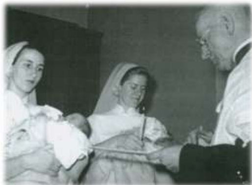
Baptême collectif célébré par Mgr Edgar LeMay, s.d. (PH-G-10,28f-13)

Venait ensuite l'heure de la consultation médicale. Tous les jours, les enfants malades ou montrant quelques symptômes étaient présentés au médecin, qui prescrivait régime, soins ou médicaments. Tout était scrupuleusement noté et la prescription était remplie sans délai. Ainsi, sérums, vaccins, injections stimulantes ou nutritives étaient aussitôt administrées. À midi, après avoir été mis au sec, les enfants recevaient leur second repas; à 15h, la collation; à 18h, le souper; à 21h, minuit et 6h du matin, il fallait recommencer le même travail avec le même soin. Les troubles digestifs étaient notés attentivement afin de faire au régime les corrections qui s'imposaient. Il fallait agir promptement et sûrement, car le moindre retard pouvait être suivi d'une chute désastreuse de poids et même d'un éclat maladif excessivement difficile à corriger.