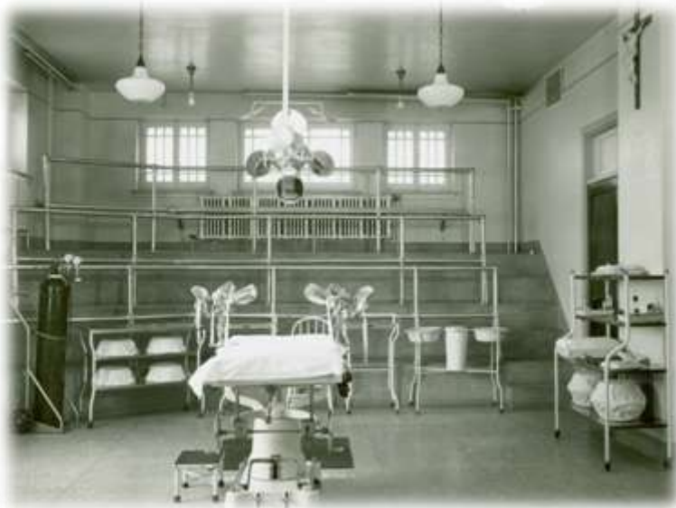
Salle d'accouchement munie de gradins pour les étudiants en médecine de l'Université Laval, vers 1949. (Album 09-09)

Le bon fonctionnement de l'Hôpital était sous la responsabilité de la directrice, assistée de deux autres religieuses. Ses bureaux étaient situés au 1 er étage où elle fournissait un accueil bienveillant aux nouvelles venues, préparait les partantes à leur retour dans le monde et recevait celles qui lui demandaient conseil. Sept autres religieuses, qui surveillaient les divers départements, complétaient le personnel.