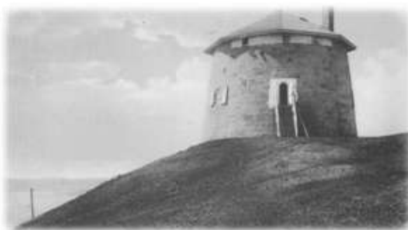
Tour Martello, s.d.

Au début du 19 e siècle, lorsqu'on ne pouvait s'occuper d'un bébé, il était fréquent qu'il soit exposé. On le portait à la tour Martello et on sonnait le tocsin. Ainsi, ceux qui désiraient adopter un petit délaissé se rendaient sur place et prenaient l'enfant. Toutefois, aucune institution existante ne pouvait pourvoir aux besoins de tant d'enfants dans la région de Québec à cette époque. Le phénomène grandissant des maternités illégitimes ne faisait qu'amener de l'eau au moulin et il devenait de plus en plus difficile de trouver des places pour les enfants issus de cette triste réalité.