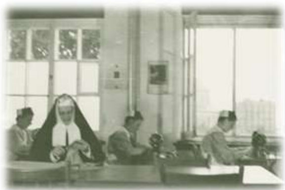
Salle de couture du 2 e étage, s.d. (Album 09-14)

Les conditions des mères célibataires s'améliorent donc à la Miséricorde, mais dans la société, elles sont toujours considérées comme des parias. Elles sont victimes des préjugés et doivent vivre leur grossesse en secret. Certaines sont rejetées par leur famille et d'autres mentent à leur proches, prétextant un voyage ou un nouvel emploi éloigné, afin d'éviter le même sort. En ce temps-là, on était cruel envers la mère célibataire. On la considérait généralement comme la seule responsable de son infortune. Et comme sa mère, l'enfant illégitime était spolié et faisait l'objet de ragots sa vie durant. Il n'était donc pas étonnant que la très grande majorité de ces mères célibataires choisissent de passer les derniers mois de leur grossesse dans des établissements comme l'Hôpital de la Miséricorde et de confier leur enfant à l'adoption afin que celui-ci puisse bénéficier d'une vie meilleure et de parents aimants.