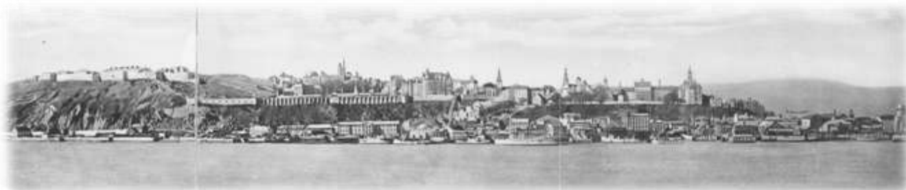
Vue panoramique de la Ville de Québec, s.d.

Au début du 19 e siècle, Québec était devenu une ville importante, ce qui impliquait qu'elle accueillait son lot de misère et de désordre. Pauvreté et prostitution pullulaient dans les rues de la ville, menant de plus en plus souvent à des situations malheureuses. Les abandons de nouveau-nés se multipliaient, ce qui poussa les autorités du Parlement canadien à faire appel aux religieuses de l'Hôtel-Dieu, qui se chargèrent de faire adopter ou de mettre en pension ces petits abandonnés à partir de 1801. Jusqu'en 1845, 1375 enfants bénéficièrent de leur protection.