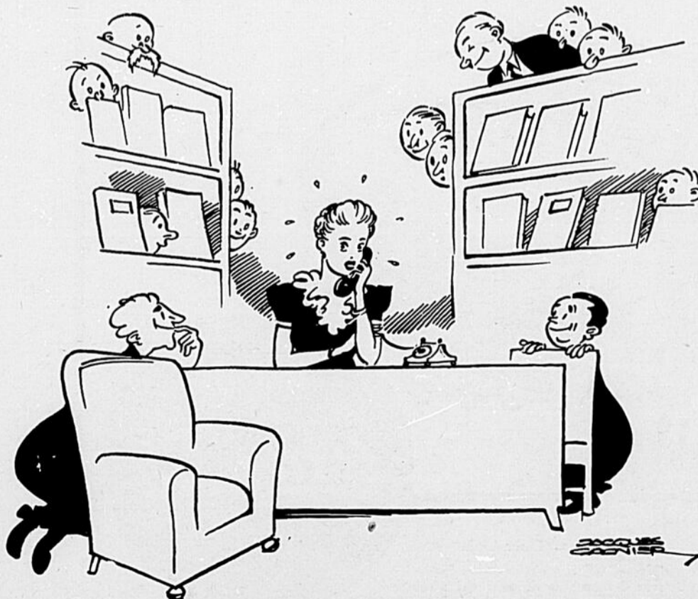
les étudiants vont aux renseignements!

10 minutes de culture spirituelle par jour