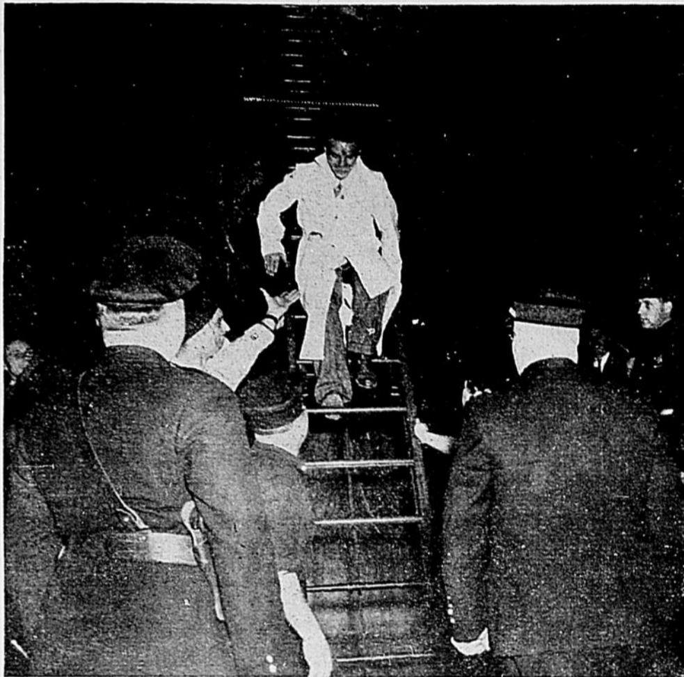
SERVICE DU ROI - O. H. M. S.

La foule se dissipe et l'on entend encore dans l'air, l'écho des chansons très originales.