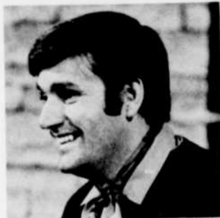
Recettes de Graham Kerr.