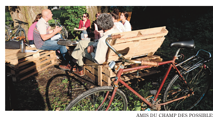
AMIS DU CHAMP DES POSSIBLES