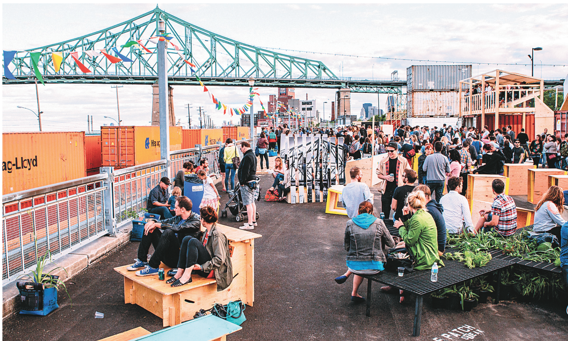
De l'esplanade bétonnée du Village éphémère (ci-dessus) à la friche verdoyante du Champ des possibles (photos de droite), des citoyens envahissent des lieux délaissés et les transforment en espaces de vie collectifs.

Chacun de leur côté ou tous ensemble, des citoyens de partout au Québec repensent leur espace de vie pour le remanier à une échelle humaine. Sans compter leur temps, en y mettant toute leur énergie, ces « super-citoyens » proposent des solutions de remplacement aux structures établies. Parfois en bousculant les conventions, souvent sans demander la permission à qui que ce soit, ils envahissent les lieux communs pour en révéler le potentiel. Le Devoir en a rencontré quelques-uns pour comprendre ce qui se cache derrière ces bancs et ces plants éparpillés aux quatre coins de nos villes et villages. Portrait de ces nouveaux rêveurs.