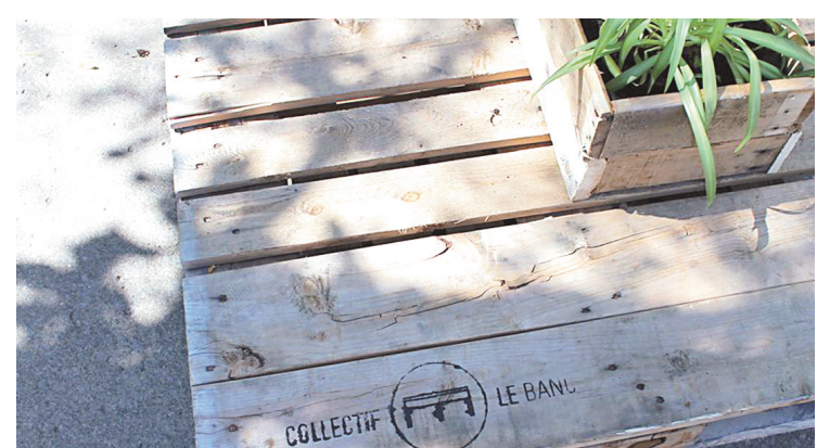
Le Collectif Le Banc construit à l'aide de bois recyclé du mobilier urbain qu'il éparpille ensuite dans la ville de Québec.