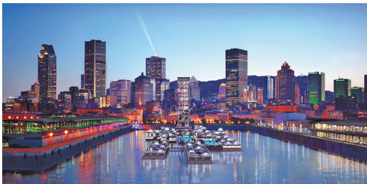
SMITH VIGEANT ARCHITECTES INC.