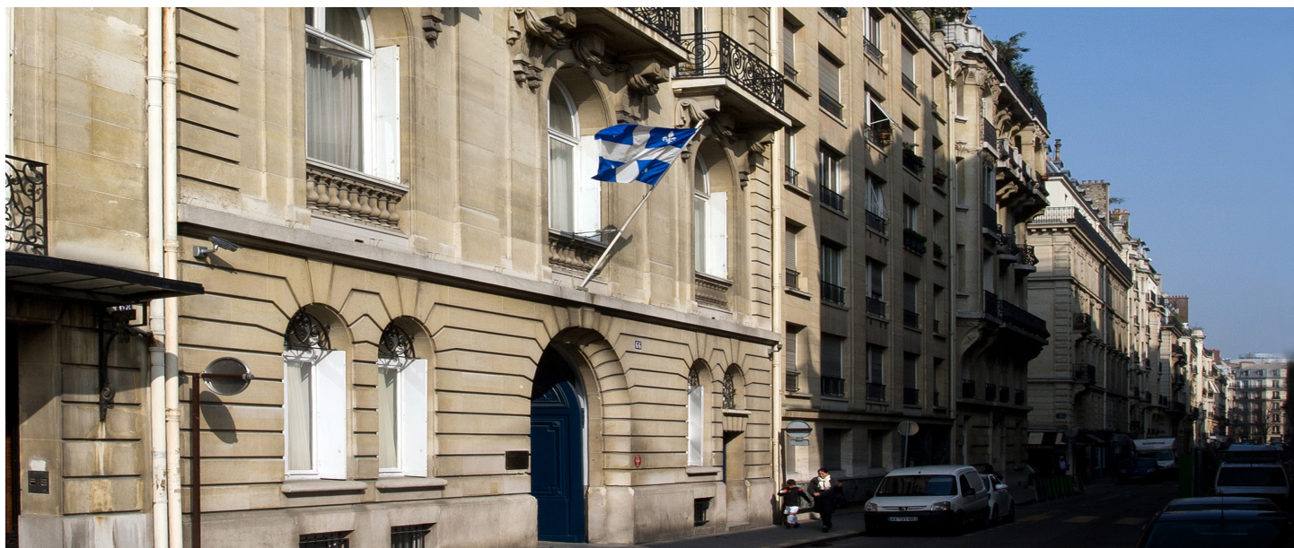
Façade de la Délégation générale du Québec à Paris, Paris.

La Délégation générale du Québec à Paris est la représentation officielle du Québec en France et à Monaco. Elle veille à la promotion et à la défense des intérêts du Québec et œuvre au renforcement de la relation franco-québécoise dans tous les domaines, aussi bien culturel, économique et politique que social. Elle participe également à la gestion de programmes de coopération franco-québécoise.