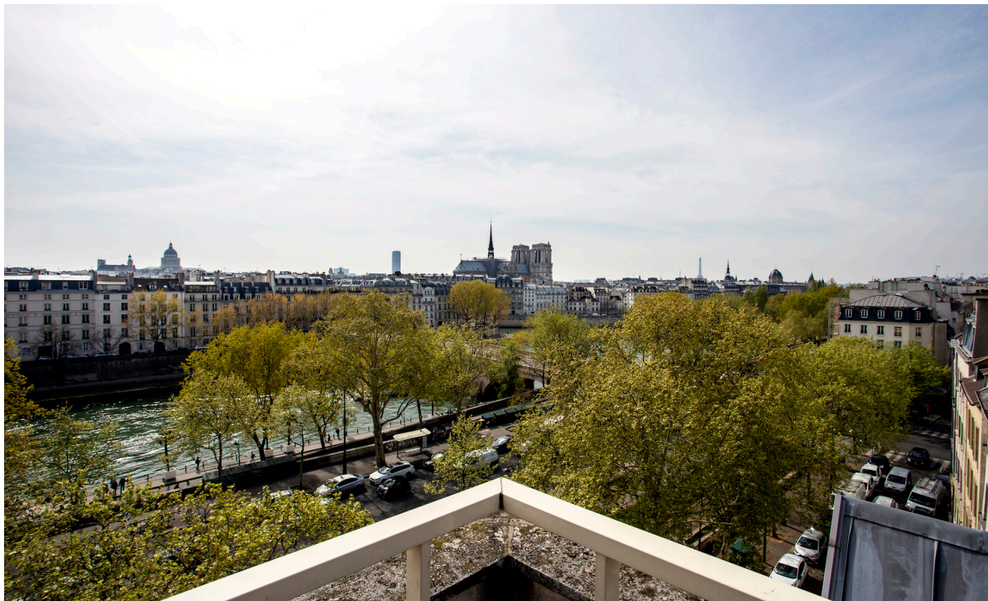
Vue depuis la coursive, site du Marais de la Cité internationale des arts, Paris.

Vous êtes une ou un artiste ou vous travaillez dans le domaine des arts visuels et vous aimeriez approfondir vos recherches, trouver de l'inspiration, tisser des liens à l'étranger, trouver une résidence d'artiste ou une bourse à la mobilité en France? Le présent guide répertorie des conseils et des liens utiles, proposés par le Service des affaires culturelles de la Délégation générale du Québec à Paris.