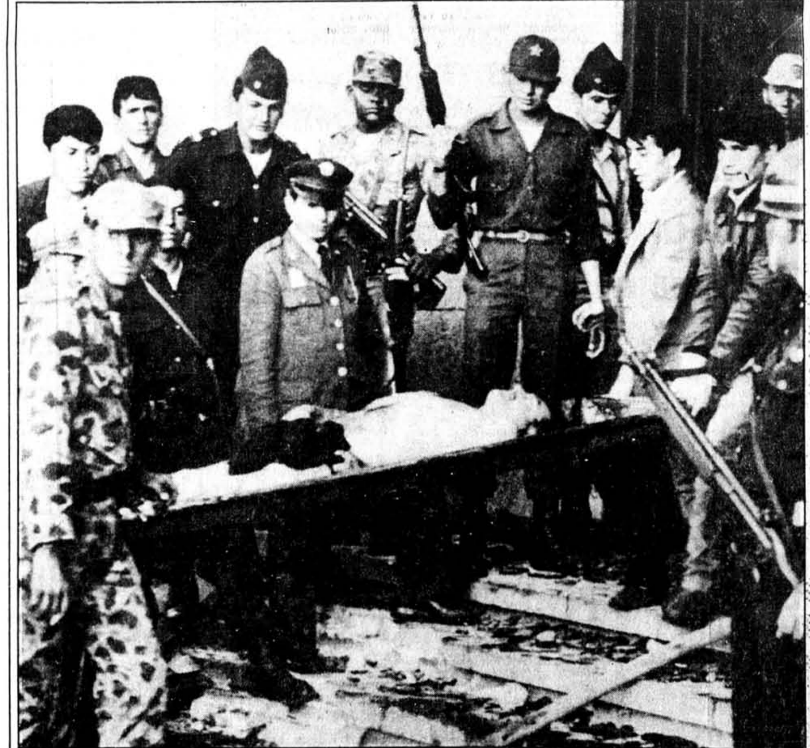
Des soldats colombiens transportent le cadavre du leader du commando de guerrilla M-19 qui s'est attaqué hier à l'édifice de la Cour suprême, dans la capitale de Bogota. Il

Le ministre Russell et des représentants de la société néo-écossaise des alcools doivent rencontrer le ministre fédéral de la Santé, Jake Epp, le 21 novembre prochain, pour discuter des problèmes liés à la présence de produits chimiques dans les vins et tenter de mettre au point une méthode uniforme pour tester ces boissons.