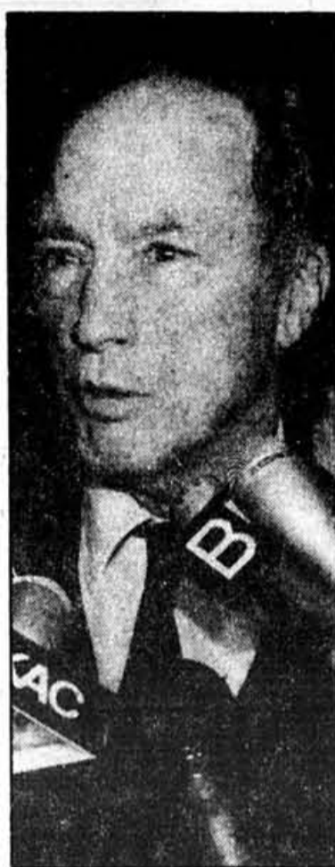
Pierre Elliott Trudeau

Le secrétaire-général du Commonwealth a précisé que le comité serait appelé à fournir à toutes les parties directement impliquées dans la crise sud-africaine un mécanisme de dialogue et que les « personnalités éminentes » décideraient eux-mêmes de la marche à suivre à l'intérieur du mandat défini à Nassau.