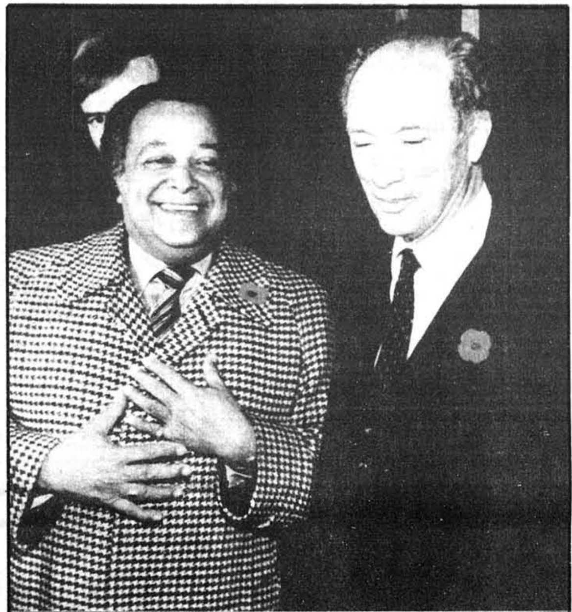
L'ex-premier ministre Trudeau, qui a reçu hier le secrétaire général du Commonwealth, décidera la semaine prochaine s'il participera à un «comité des sages» sur l'apartheid.