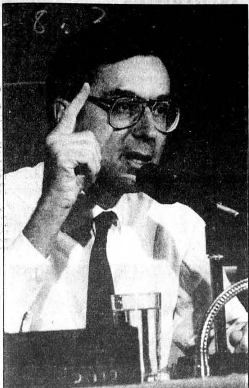
Le chef libéral Robert Bourassa.