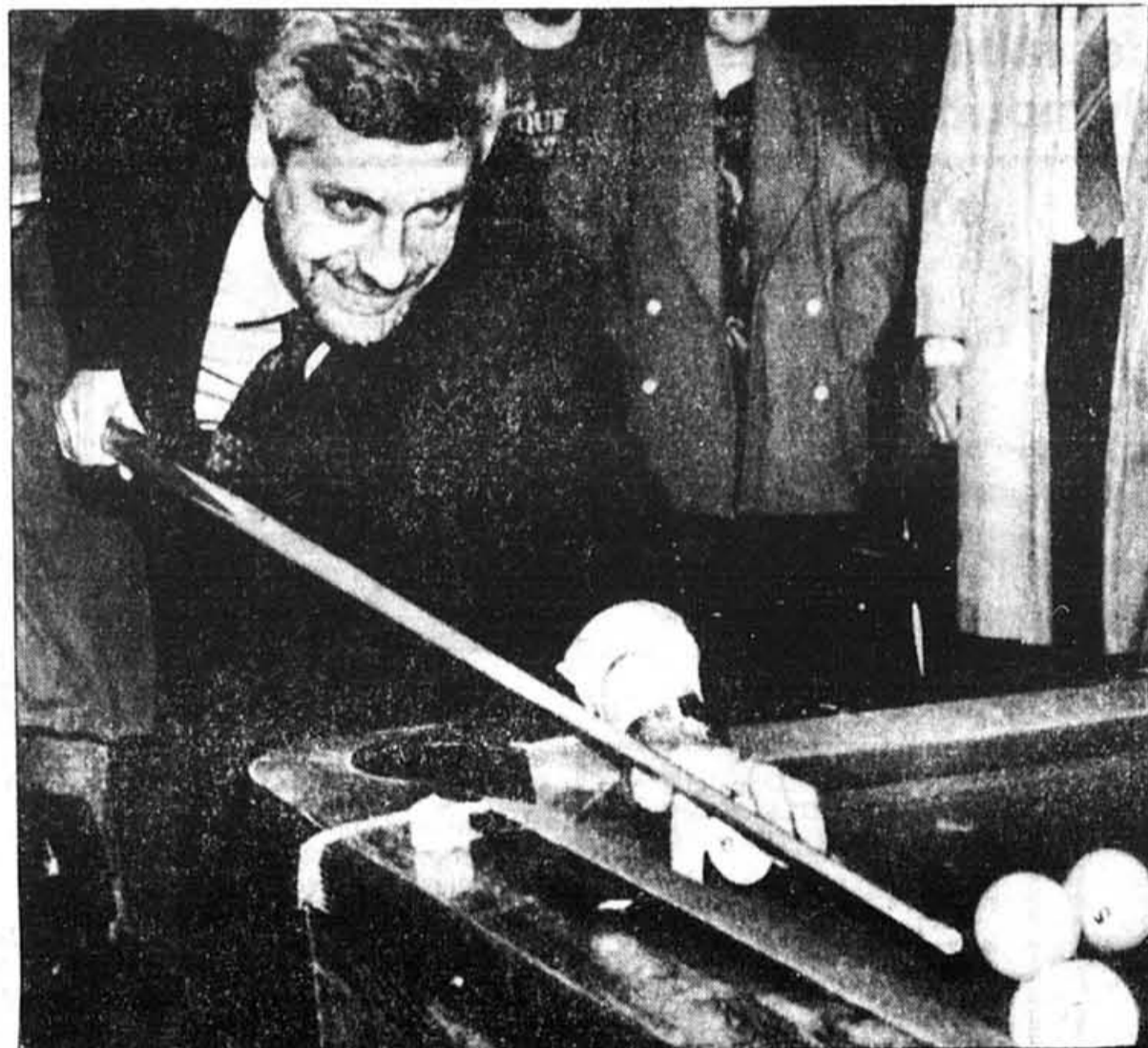
À Québec hier, le premier ministre Pierre Marc Johnson s'est donné le plaisir d'un petit billard, au Club des employés civils.