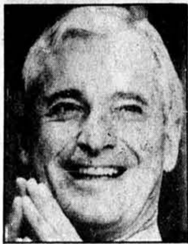
John Turner

« Le parti libéral se remet de sa défaite de septembre 1984, a seulement expliqué M. Turner; le moral est bon, les finances s'améliorent et l'opposition parle-