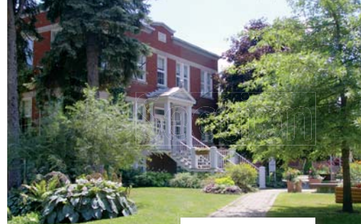
Mairie (204, rue Principale)