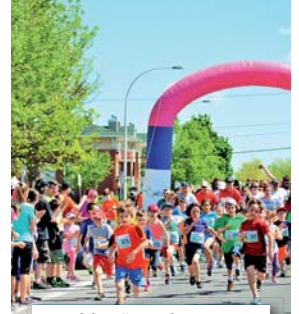
Défi familles en forme 2015

Seul un sommaire des activités, événements et manifestations spéciales est présenté à cette revue pour la période du vendredi 26 février au jeudi 26 mai ; consultez le calendrier du site Web pour plus de détails.